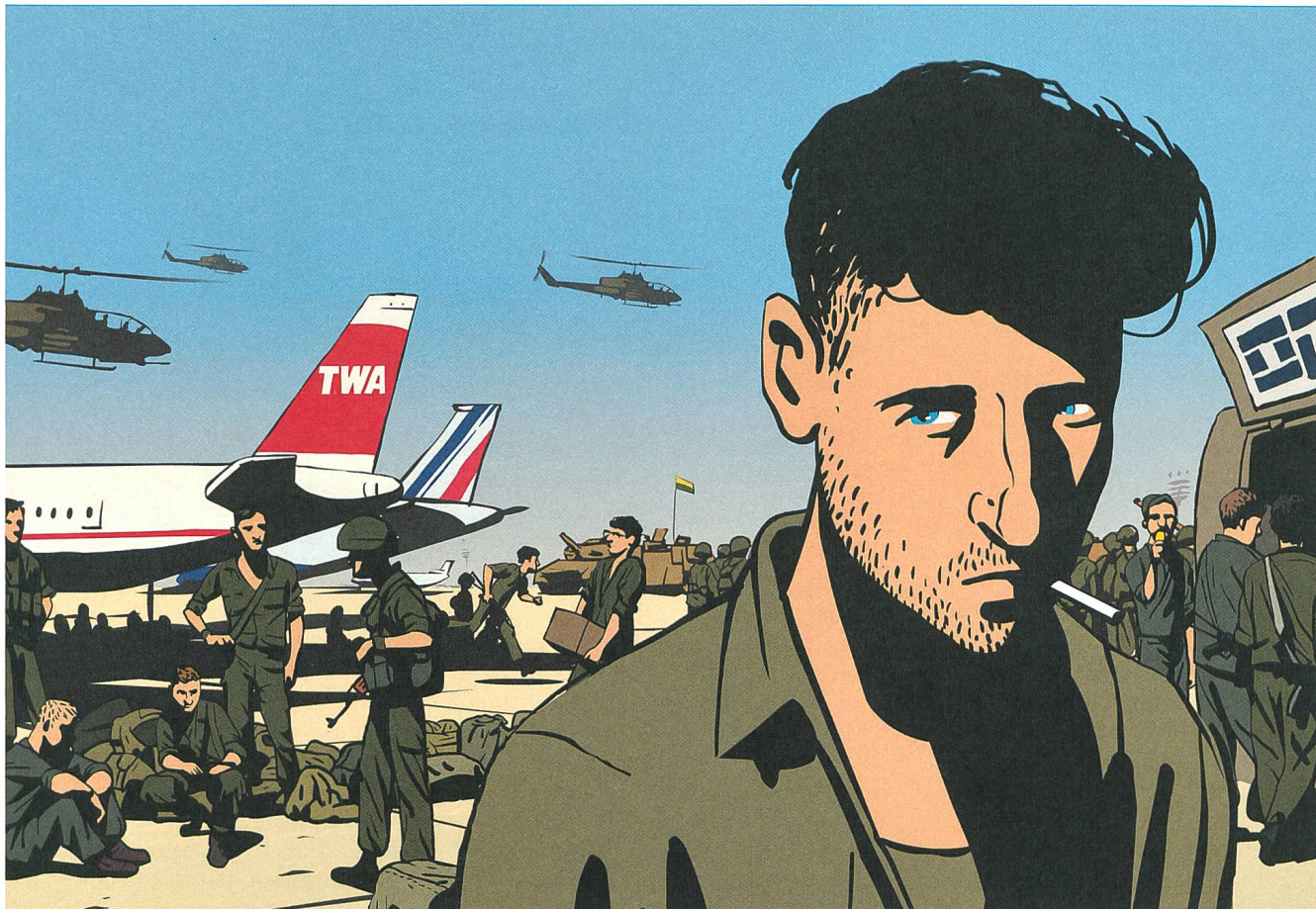
Waltz with Bashir (2008) Regie: Ari Folman

Verlag Filmbulletin Dienersstrasse 16 CH-8004 Zürich +41 52 226 05 55 info@filmbulletin.ch www.filmbulletin.ch