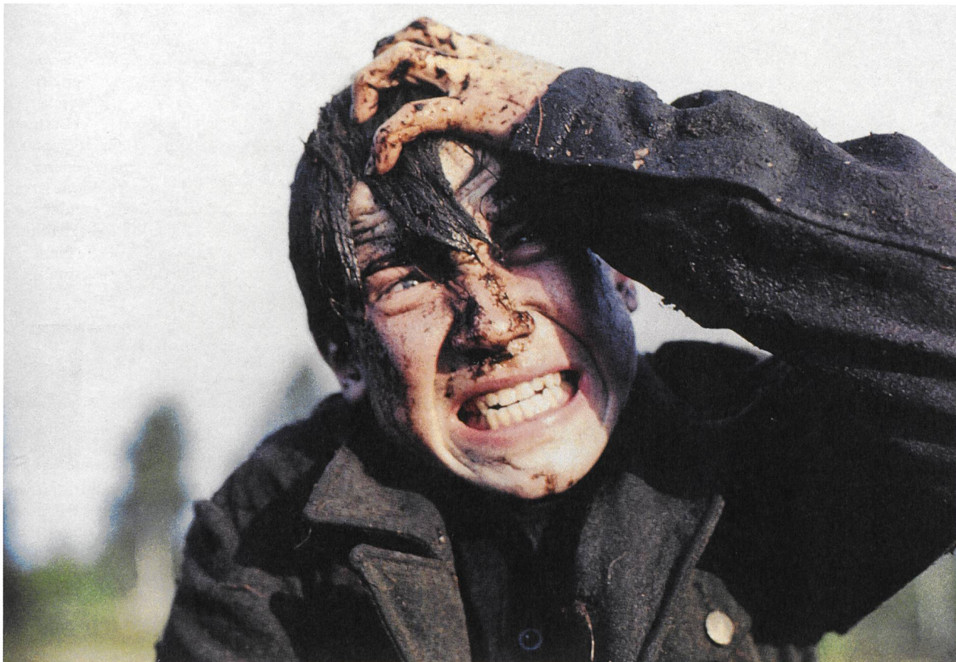
Idi i smotri (1985) Regie: Elem Klimov