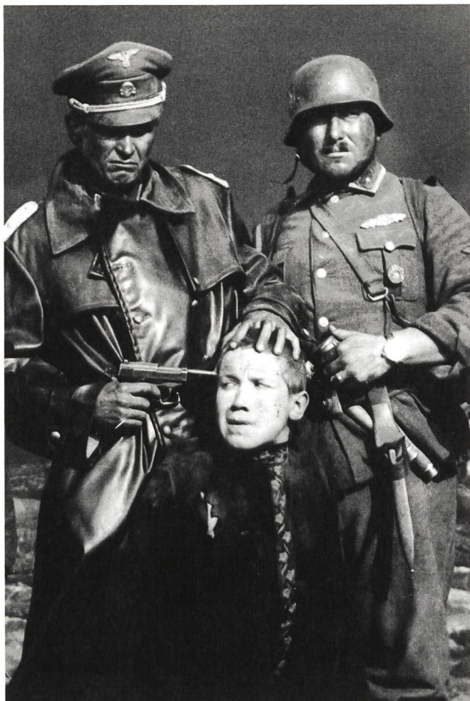
Idi i smotri (1985) Regie: Elem Klimow