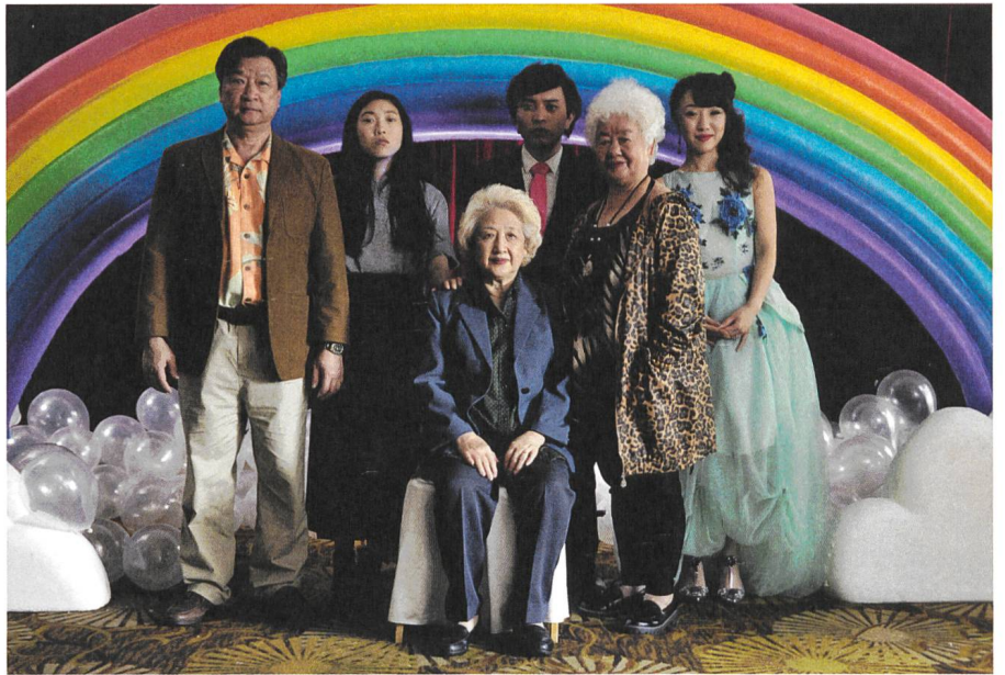
The Farewell Regie: Lulu Wang