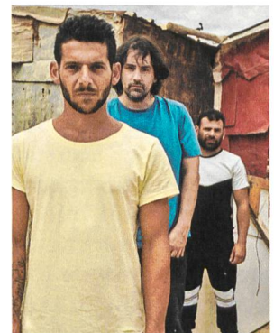
Entre dos Aguas