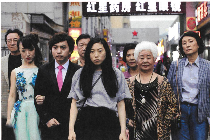
The Farewell mit Awkwafina als Billi (Mitte)