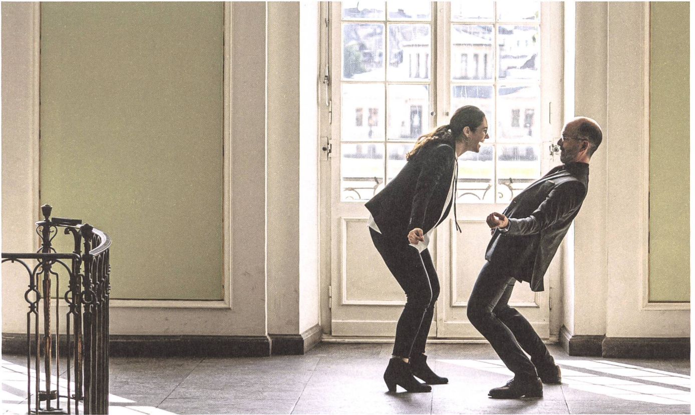
Contra Regie: Sönke Wortmann