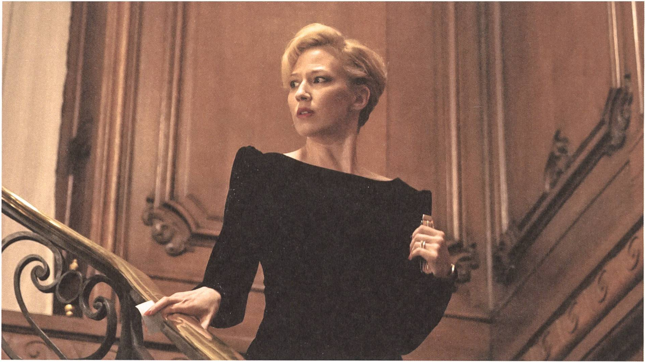
The Nest Regie: Sean Durkin