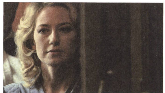
The Nest mit Carrie Coon