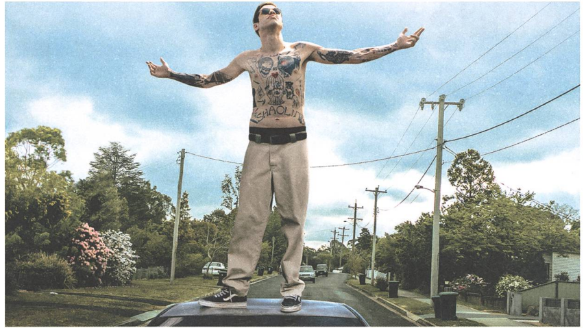
The King of Staten Island Regie: Judd Apatow