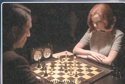
DAS DAMENGAMBIT (Netflix)

Shirin von Abbas Kiarostami (2009). Sammlung Cinémathèque suisse. Alle Rechte vorbehalten.