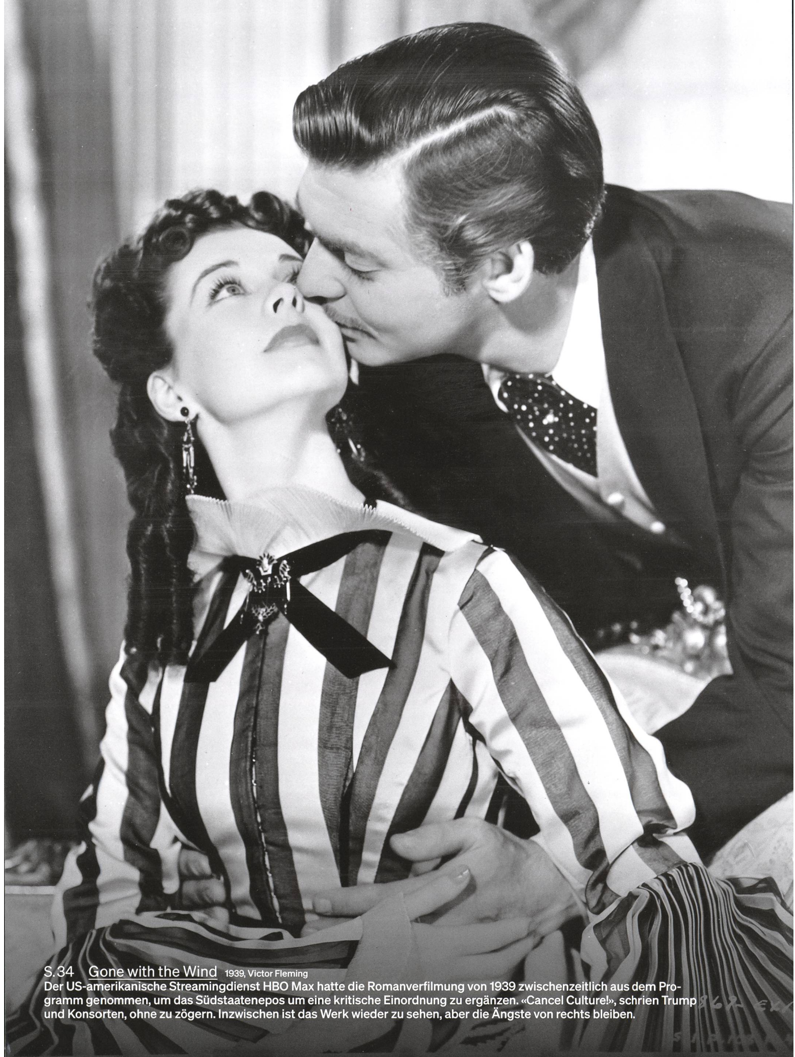
S.34 Gone with the Wind 1939, Victor Fleming

Der US-amerikanische Streamingdienst HBO Max hatte die Romanverfilmung von 1939 zwischenzeitlich aus dem Programm genommen, um das Südstaatenepos um eine kritische Einordnung zu ergänzen. «Cancel Culture!», schrien Trump und Konsorten, ohne zu zögern. Inzwischen ist das Werk wieder zu sehen, aber die Ängste von rechts bleiben.