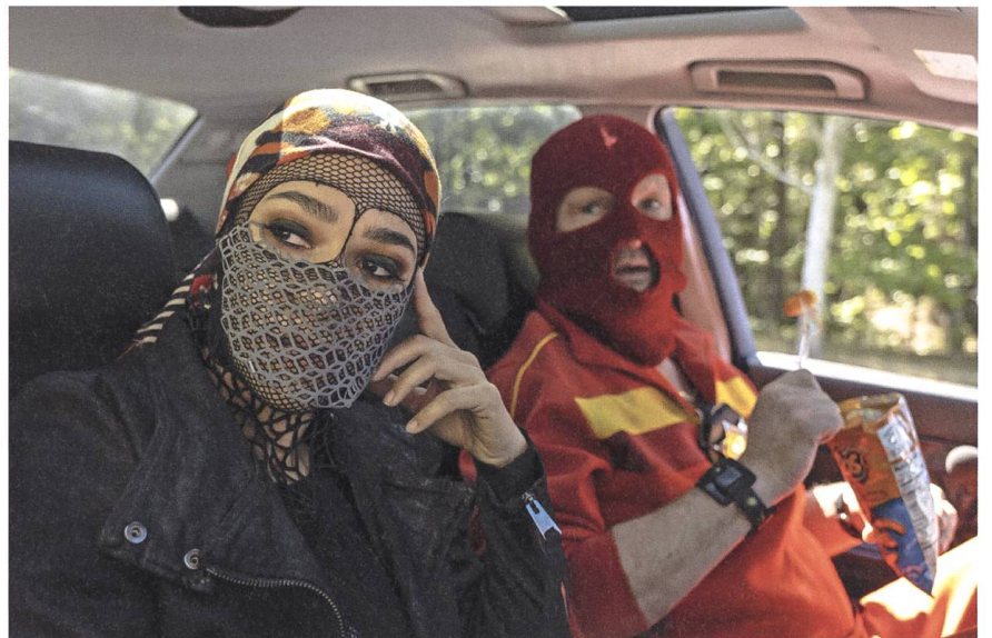
Watchmen 2009, Damon Lindelof