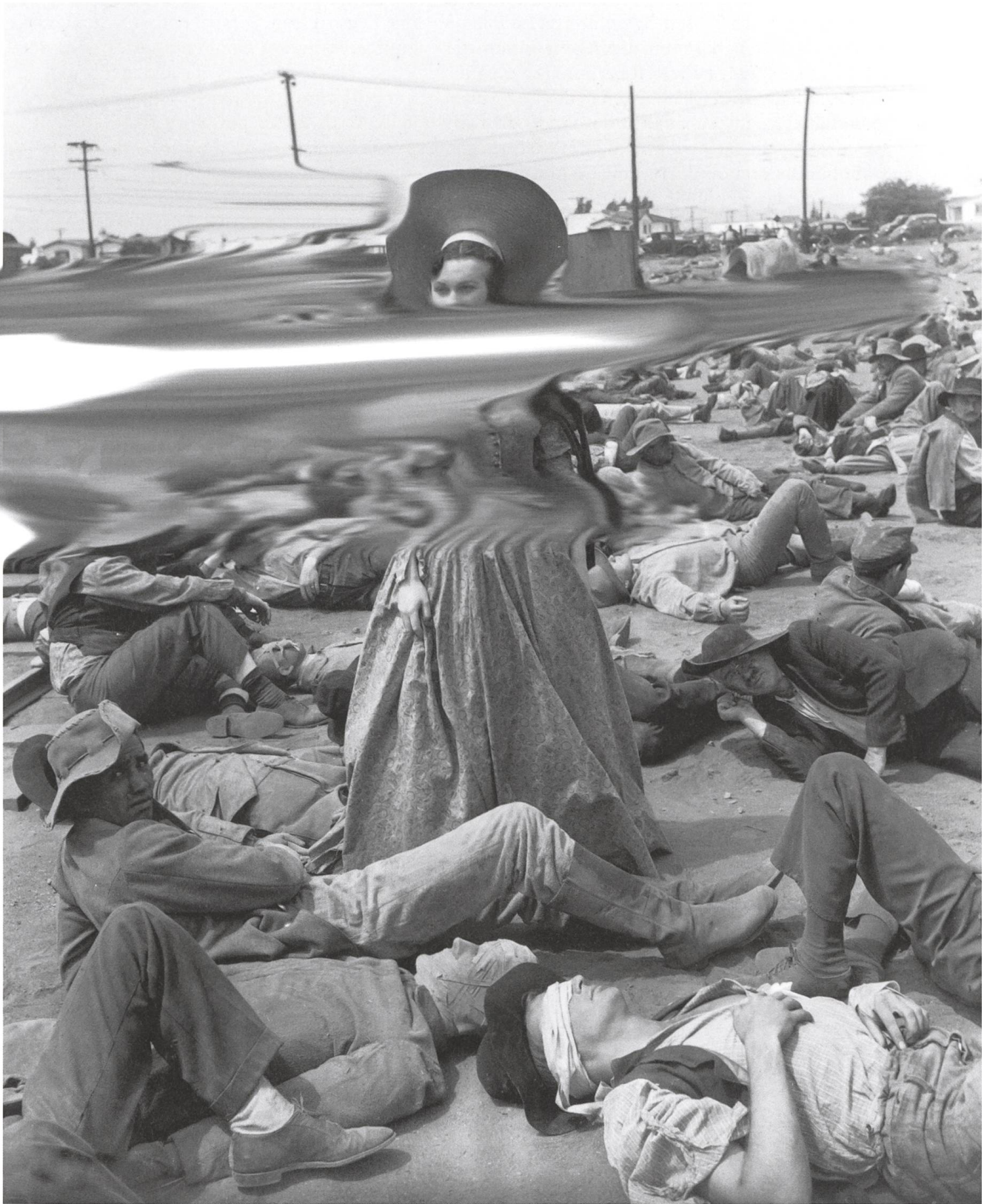
Gone with the Wind 1939, Victor Fleming