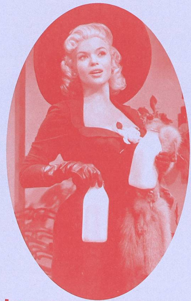
Jayne Mansfields Nippelgate