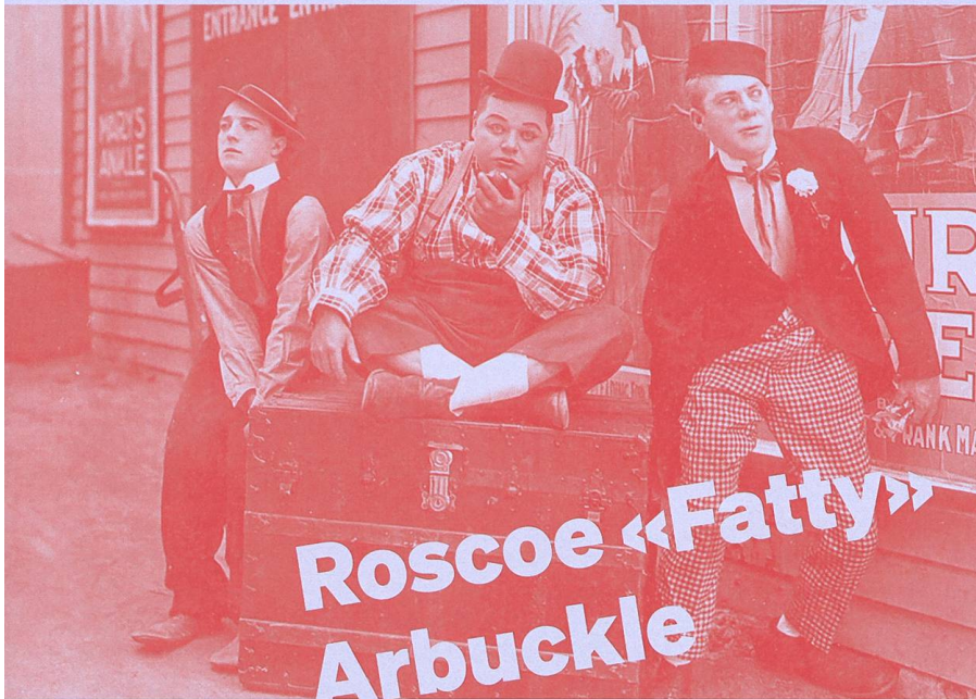
Roscoe «Fatty» Arbuckle

Zu Beginn der Zwanzigerjahre war Arbuckle ein riesiger Star, bis eine 24-Jährige nach einer wilden Party, die der Stummfilm-Star in einem Hotelzimmer in San Francisco schmiss, verstarb. Es kam zum Prozess, dann zum öffentlichen Skandal, dann zum Freispruch.