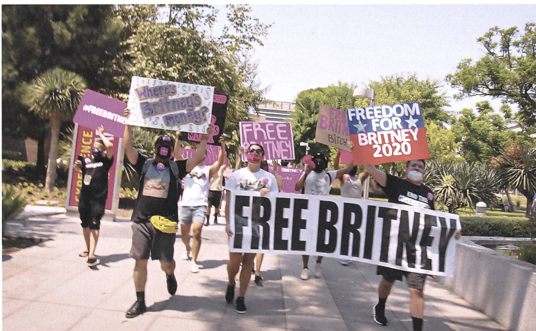
Framing Britney Spears 2021, Samantha Stark