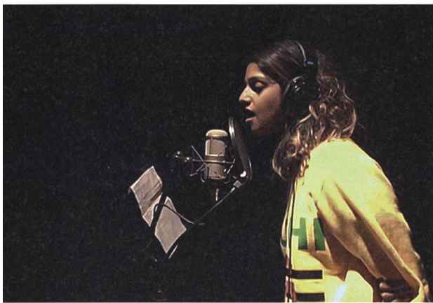
Matangi/Maya/M.I.A. 2018

Was die Filme – wenn auch nur indirekt – auch klar machen, ist, dass die Lebensrealitäten der portraitierten Berühmtheiten nicht weiter von denen der durchschnittlichen Bürger*innen entfernt sein könnten: This Is Paris wurde grösstenteils in Hiltons Villa in Los Angeles gefilmt, die mit Schmuck und Designerkleidern gefüllt ist, und gemäss Framing Britney Spears hat die Sängerin seit ihrem Comeback 58 Millionen Dollar Umsatz in nur zwölf Monaten gemacht. Wieso also interessieren uns deren Höhen und Tiefen, wieso identifizieren wir uns so sehr mit ihren Problemen? Richard Dyer liefert in seinem Buch «Heavenly Bodies: Film Stars and Society» zumindest eine mögliche Antwort: Wir sind fasziniert von Celebrities, weil sie uns helfen, zu verstehen, was es heisst, eine Person in einer spezifischen gesellschaftlichen Ordnung zu sein: Kategorien wie Klasse, Geschlecht, Religion