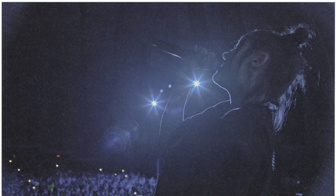
Billie Eilish: The World's a Little Blurry 2021, R.J. Cutler

britneyspears 🌟 There's always a way out!!!! This looks like paradise 🌴🌊🌴