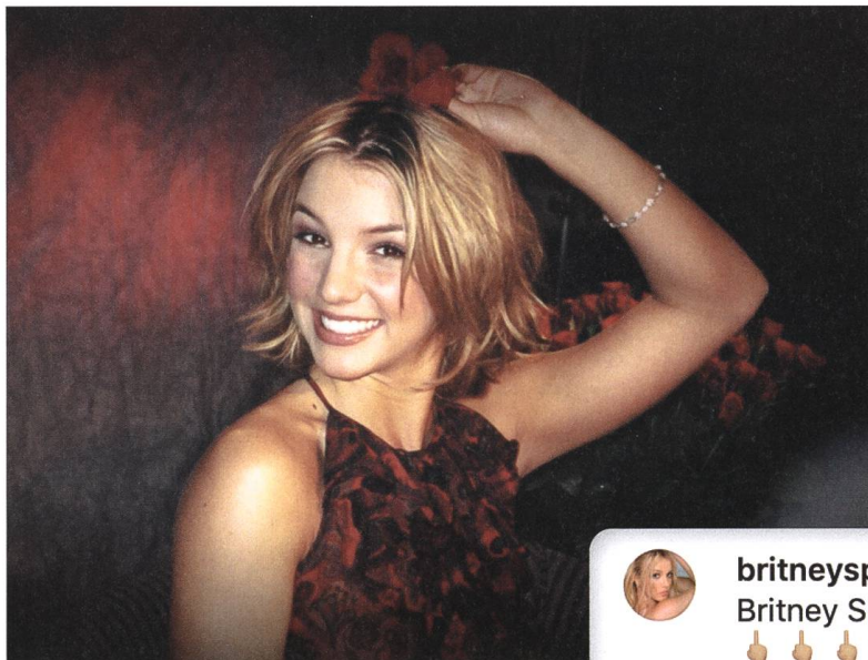
Framing Britney Spears 2021, Samantha Stark