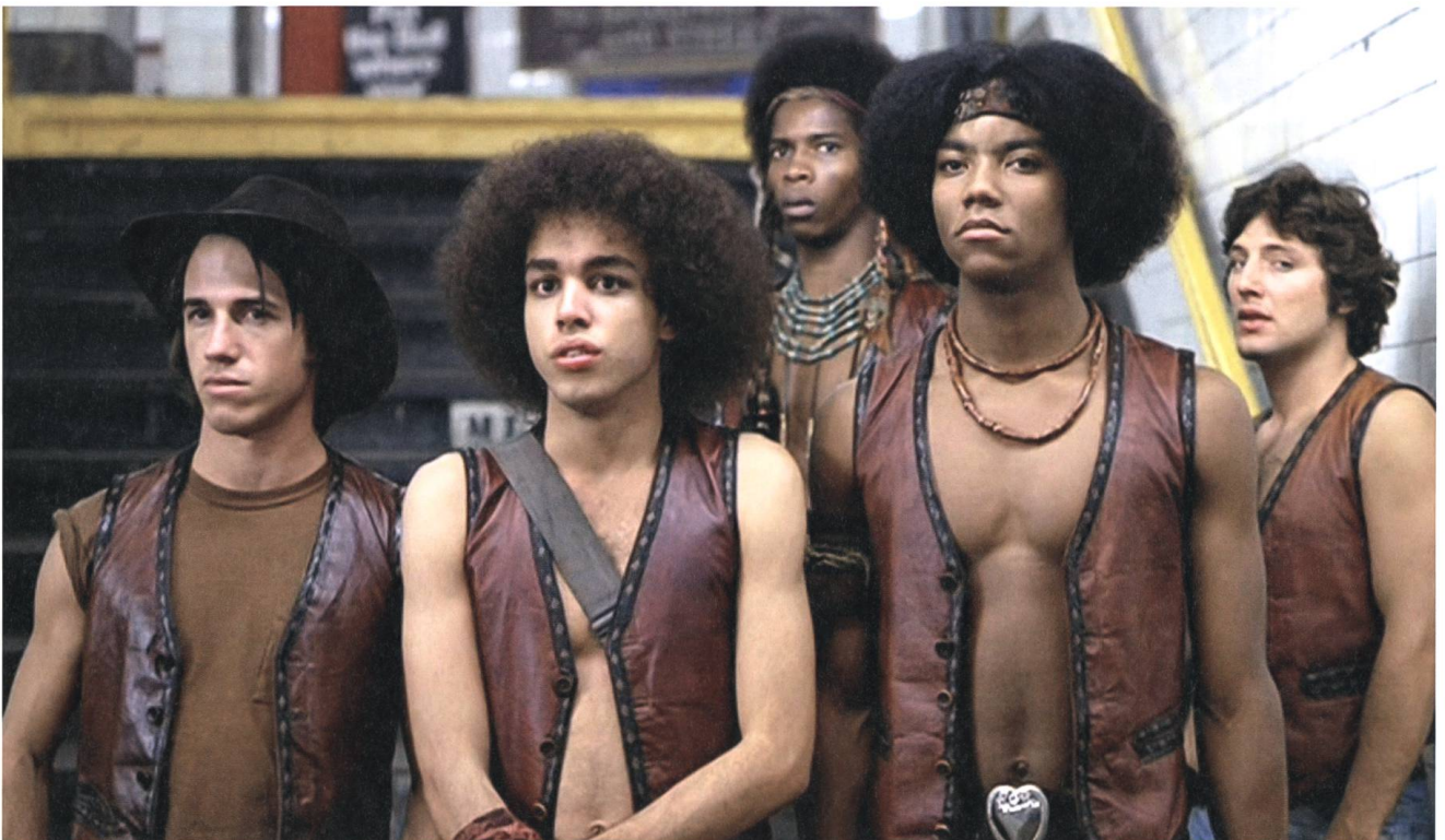
The Warriors 1979, Walter Hill

«Ich will neue Ideen an ein neues Publikum herantragen, so entstehen Dialog und Verständnis.»