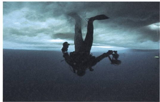
The Wild Blue Yonder 2005, Werner Herzog

Rick and Morty und Penguins of Madagascar sind in diesem Sinne ironische Kommentare zu Herzogs Überzeugung. Gemeinsam mit anderen Beispielen entsteht ein Netz aus Referenzen, das auf Herzogs Werk zurückverweist, spielerisch damit bricht und es gleichzeitig weiterspinn. Mit der Wahl seiner Gastauftritte bestimmt Herzog diese Weiterentwicklung des eigenen filmischen Universums entscheidend mit. Er,