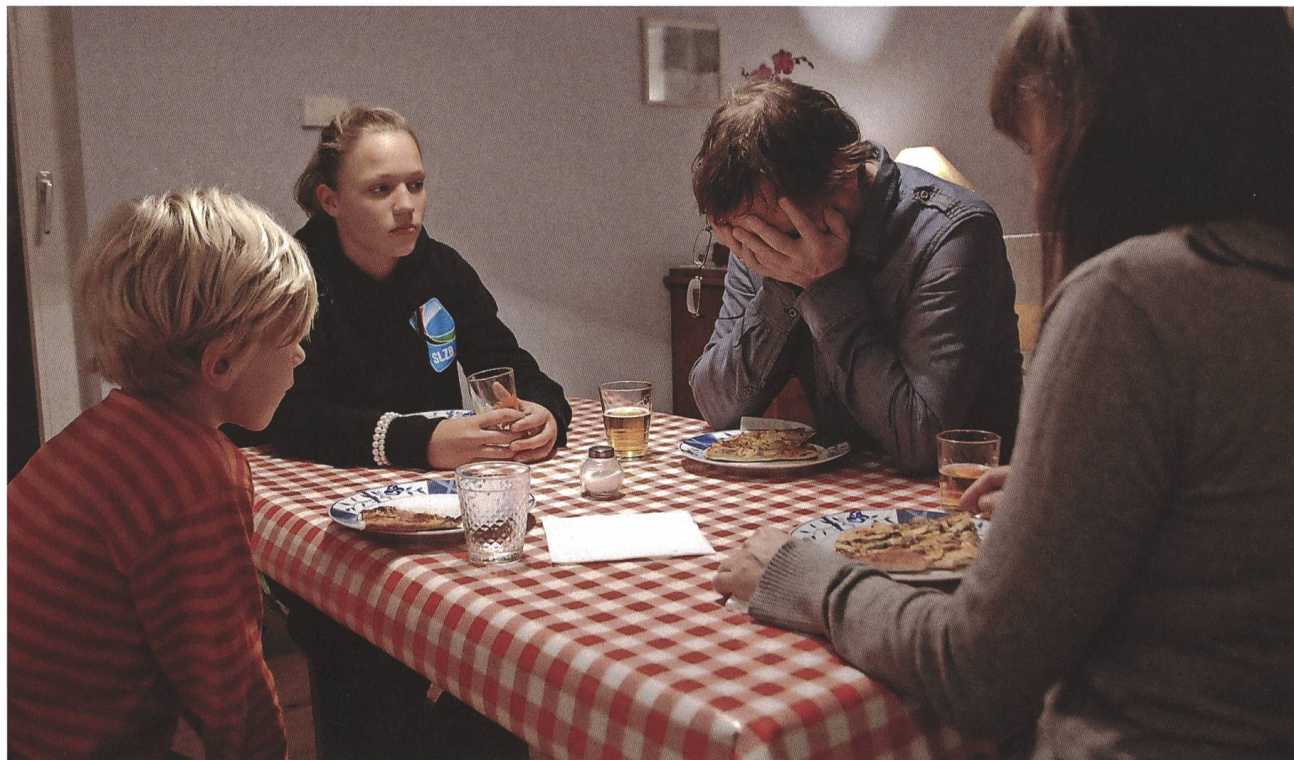
Halt auf freier Strecke 2011, Andreas Dresen

«Ich verlange nicht nach unmöglichen Sachen oder überziehe das Budget, ich bin pflegeleicht.»