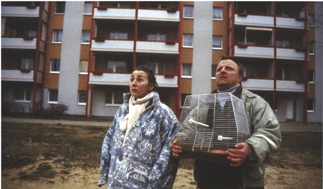
Halbe Treppe 2002, Andreas Dresen

«Ich bin nicht jemand, der eine ästhetische Monstranz vor sich herträgt. Die Stilistik ergibt sich aus dem Stoff.»