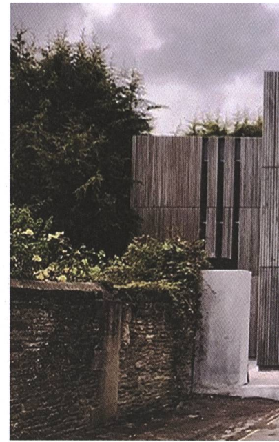
Am Set von The Girl Before 2021, J.P. Delaney

LB Das Bewusstsein, dass man sich vor der Kamera oft ausgeliefert und nackt fühlt. Das fängt schon beim Casting an. Jetzt versuche ich zu verhindern, was mich damals selbst bei Castings gestört hat. Die Schauspieler:innen sollen eine gute Erfahrung machen, es geht darum, sich kennenzulernen. Wir gehen gemeinsam durch die Sache. Es soll nicht einfach sein: Hey, jetzt zeig mal, was du kannst. Auch in der Zusammenarbeit beim Dreh ist mir ein freundschaftlicher Austausch wichtig. Ich nenne es jetzt Freundschaft, obwohl es keine Freundschaft