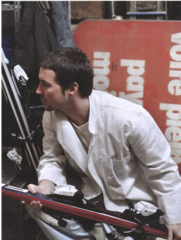
L'enfant d'en haut 2012, Ursula Meier

UM Ich erkenne mich in ihnen wieder und finde das sehr wichtig. Selbst mache ich es auf persönliche, individuelle und intime Weise, weniger öffentlich.