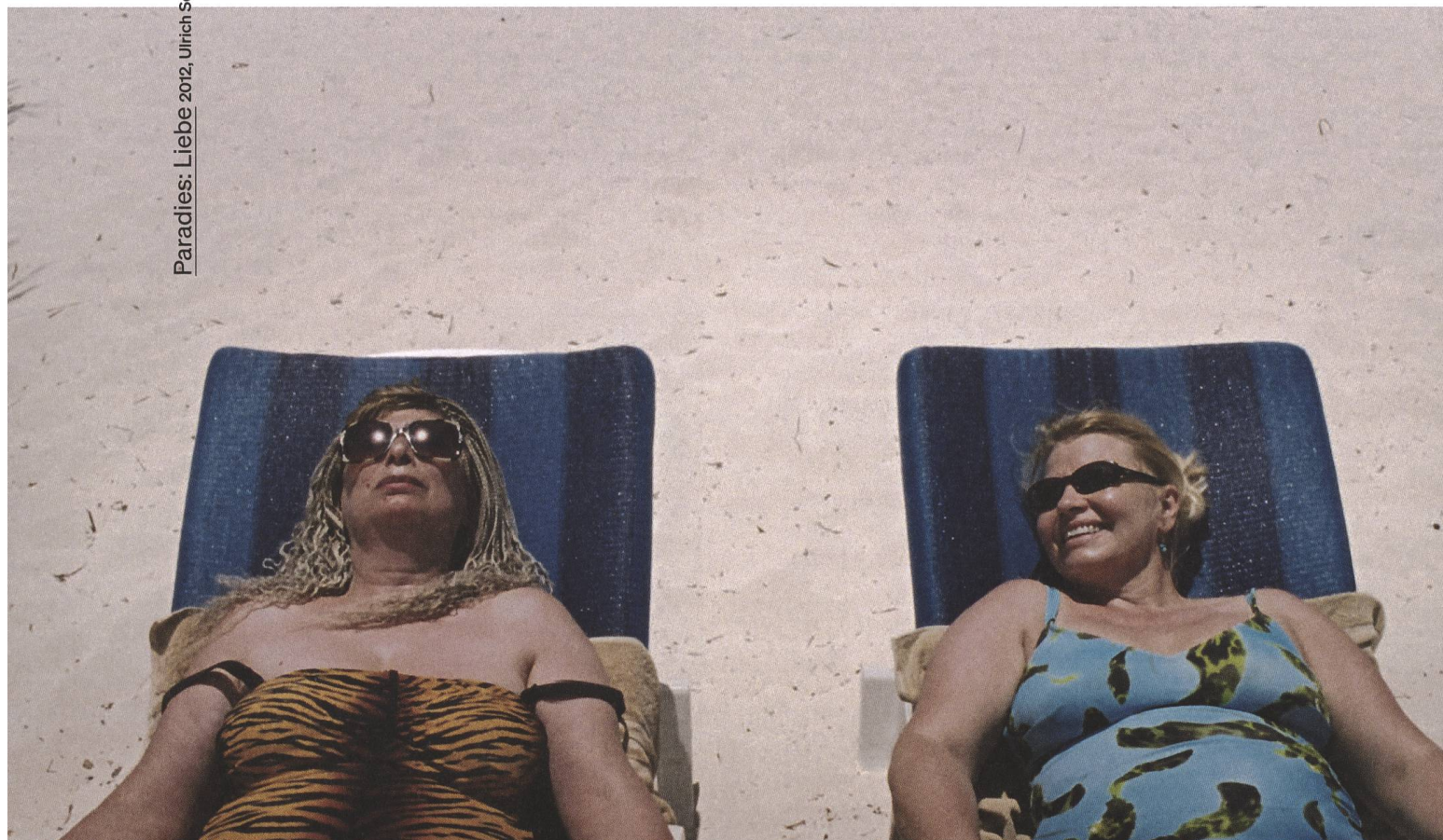
Paradies: Liebe 2012, Ulrich Seidl

US Meine Filme haben keine Message. Und wie Sie richtig sagen, sind meine Filme nicht nach einer politischen Gesinnung ausgerichtet, sondern gesellschaftskritisch. Das ist natürlich auch politisch,