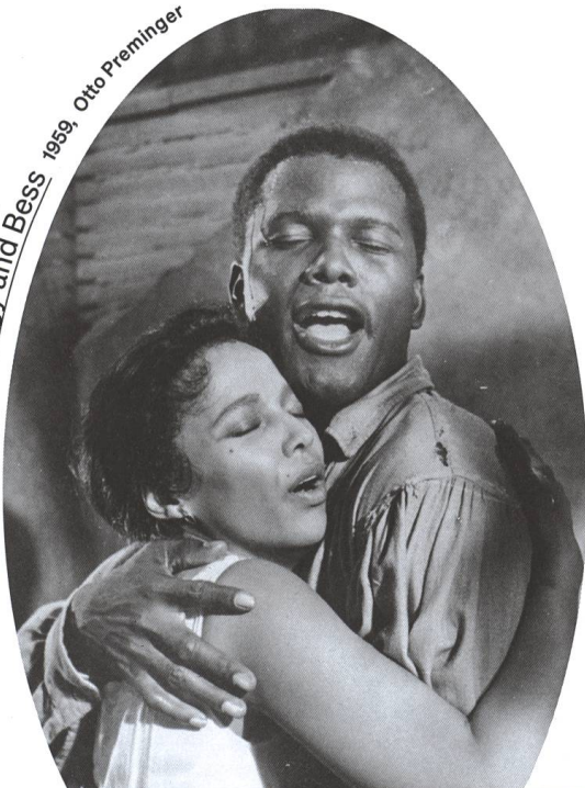
Porgy and Bess 1959. Otto Preminger