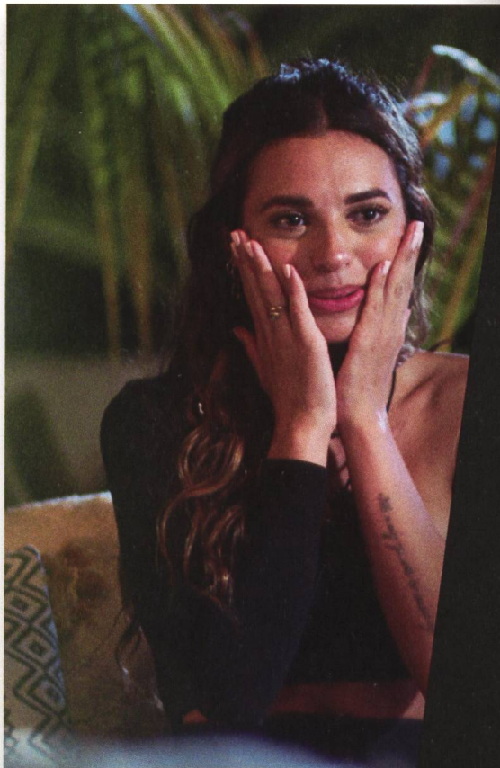
Too Hot to Handle 2020–, Robin Morgan

Was sich bis heute hält, ist die Lust am Zuschauen, unsere Liebe zur fabrizierten Realität. «Echte» Menschen beobachten, bei was auch immer, faszinierte 1948 mit harmlosen Streichen bei Candid Camera und funktioniert 2023 mit Dating auf der Insel, Backen, Verkuppeln – mit allem, was irgendwie banal ist und doch ein kleines bisschen Potential zum Skandal hat.