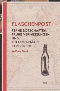
③ Wolfgang Struck: Flaschenpost. Ferne Botschaften, frühe Vermessungen und ein legendäres Experiment. Mare 2022