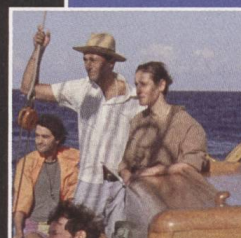
② Human Flowers of Flesh (Helena Wittmann, D/F 2022) ©Grandfilm; 2022 im Programm des Locarno Film Festival und seit Februar 2023 in deutschen Kinos