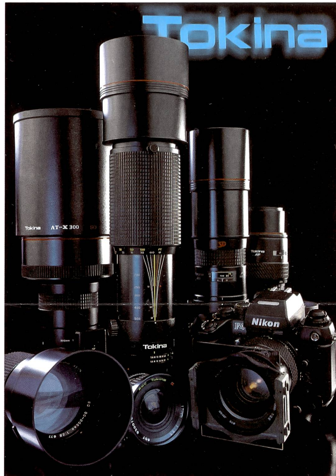
Die Tokina AT-X-Reihe wurde mit hoher Lichtstärke und bester optischer Korrektur für höchste professionelle Ansprüche entwickelt.

Nabholz: Man muss auch unter den Grossverteilern differenzieren. Gehören beispielsweise Eschenmoser oder Foto Hobby dazu? Dürfen diese etablierten Firmen, die über anerkannt gute Verkaufs- und Beratungsstrukturen verfügen, in den gleichen Topf geworfen werden wie der Mediamarkt?