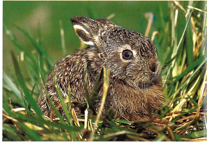
Feldhasen-Nachwuchs (Lepus europaeus) gibt's bis zu 4 x im Jahr.