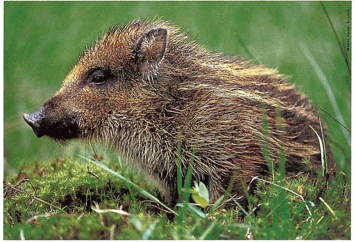
Der Wildschwein-Frischling ( Sus scrofa ) streift im Frühling umher.