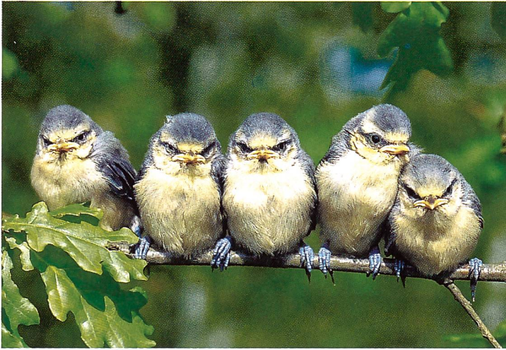
Blaumeisen-Flügglings (Parus caeruleus) flattern im April/Mai los.