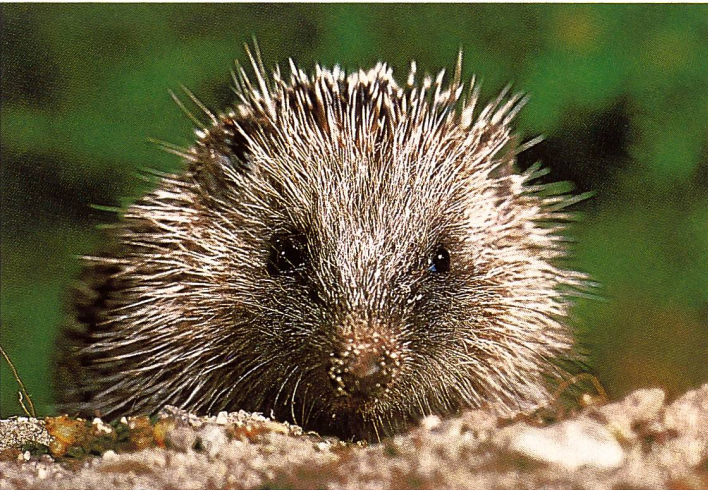
Igel (Erinaceus europaeus) sind von Mai bis September jung.