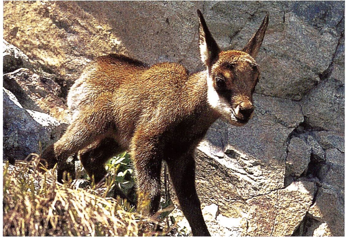
Das Gems-Kitz ( Rupicapra rupicapra ) steht ab Mitte Mai am Berg.