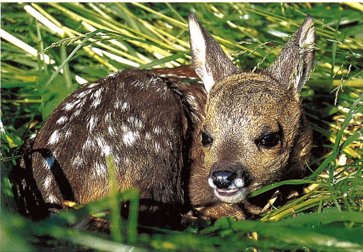
Reh-Kitz (Capreolus capreolus) macht erste Kapriolen im Mai/Juni.