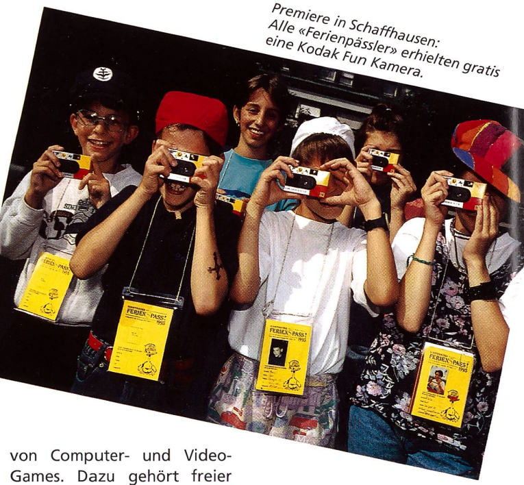
Premiere in Schaffhausen: Alle «Ferienpässler» erhielten gratis eine Kodak Fun Kamera.

ungsweise «Le stylo habile», gab. Die Camp-Teilnehmer konnten wählen zwischen den Themen Sport, Trends, Wirtschaft, Natur, Kultur und Tourismus, die sie dann auch