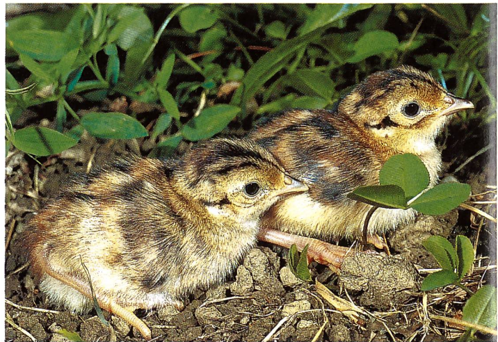
Küken des Fasans (Phasianus colchicus), April bis Juni.