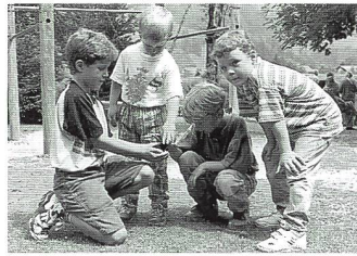
Die kleinsten Redakteure haben ein (Zeitungs-)Entlein entdeckt.

sem Erfolg verkauft werden, und alle sind sich einig, dass man sich auch nächstes Jahr wieder zur Realisierung eines solchen Projektes tref-fen wird.