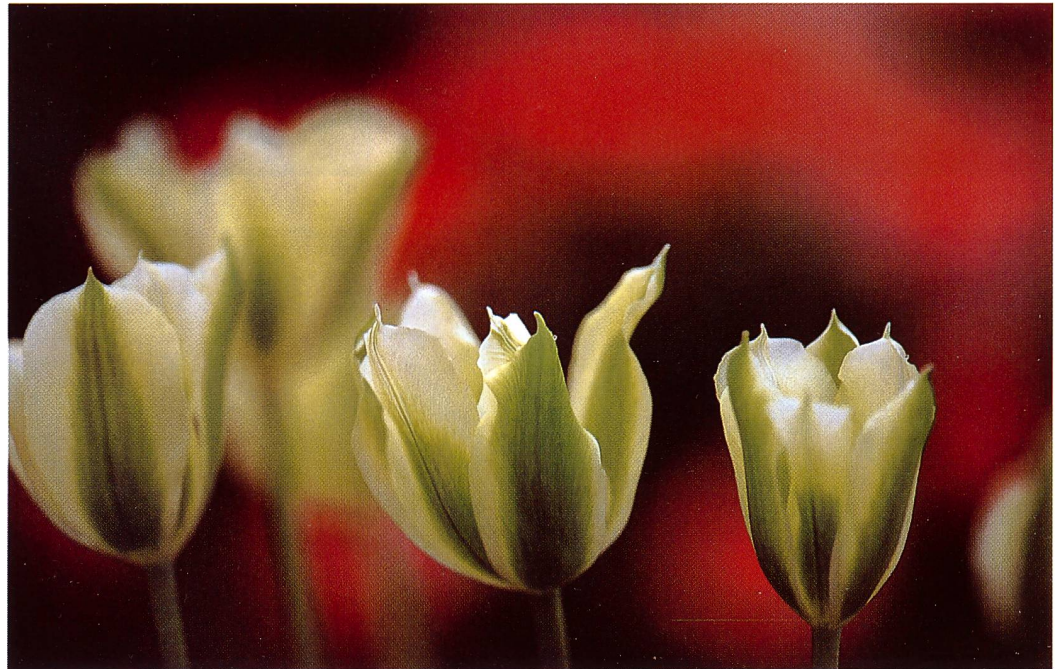
Für höchste Ansprüche und beste Schärfe im Nahbereich hat Sigma die Apo-Macro-Reihe geschaffen.

Sigma hat sich schon vor Jahren auf diese Qualitätsklasse spezialisiert und führt in