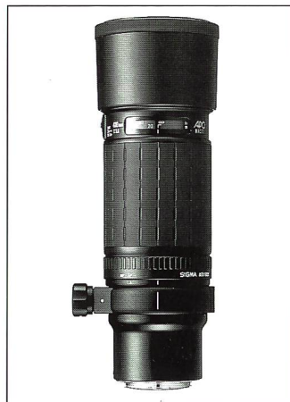
Das Sporttele: Sigma APO-Macro 1:5,6/400 mm

Auch die Jury der EISA hat wiederum ein Apo-Objektiv von Sigma zum besten Objektiv des Jahres '95-'96 ernannt. Der Gewinner ist diesmal das Sigma Apo-Macro 1:4,0/300 mm , ein Spitzenobjektiv, das sich einen Platz in der Reihe der «Firsts» sichert: Es ist das erste apochromatische Tele-