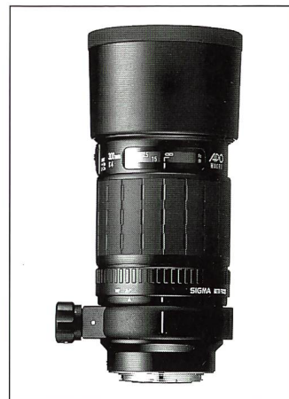
Der Perfektionist: Sigma APO-Macro 1:2,8/180 mm

objektiv, das sich direkt bis zum Abbildungsmassstab 1:3 fokussieren lässt. Auch das Sigma Apo-Macro 1:5,6/400 mm ermöglicht eine durchgehende Fokussierung bis zum Abbildungsmassstab 1:3, mit dem Vorteil einer grösseren Aufnahmeentfernung, was sich besonders bei Tieraufnahmen bewährt, da der Fotograf weniger schnell in die Fluchtdistanz des Tieres gelangt.