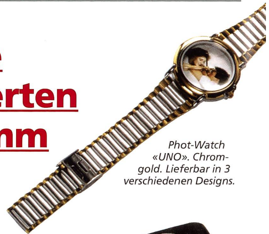
Phot-Watch «UNO». Chromgold. Lieferbar in 3 verschiedenen Designs.

Für die genaue Zeit und das Festhalten eines zeitlosen Augenblicks... Foto-Uhren mit dem persönlichen Foto: Sechs verschiedene Armbanduhr-Modelle mit Plastik-, Leder- oder Metallarmband. Aussergewöhnlich ist die Taschenuhr im verchromten Metallgehäuse. Ebenso gibt's