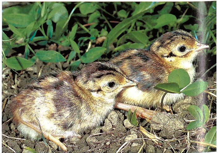
Küken des Fasans ( Phasianus colchicus ), April bis Juni.