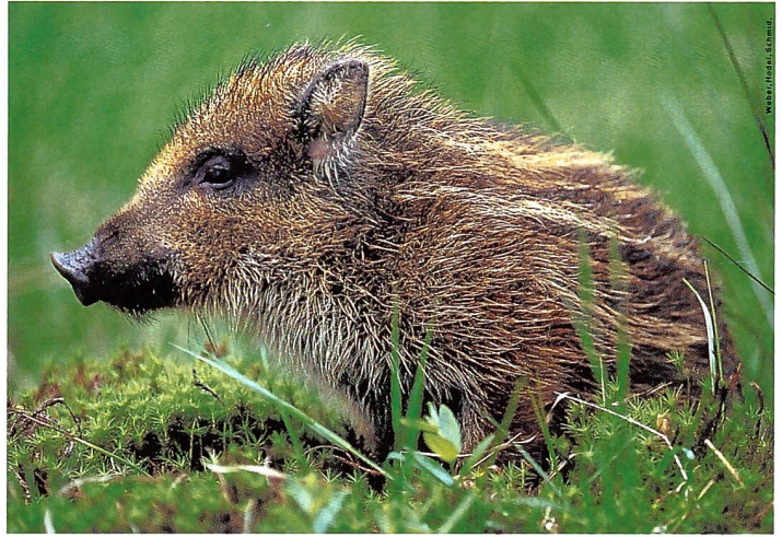
Der Wildschwein-Frischling ( Sus scrofa ) streift im Frühling umher.