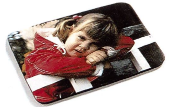
Computer-Mausmatte mit dem persönlichen Mehrfarbendruck von eigenen Fotos.

eine Tischuhr, eine Wanduhr, eine Posteruhr und für alle die's gern gross haben: die Big Watch mit 1.30 m Länge und einem Zifferblatt-Durchmesser von 16.5 cm.