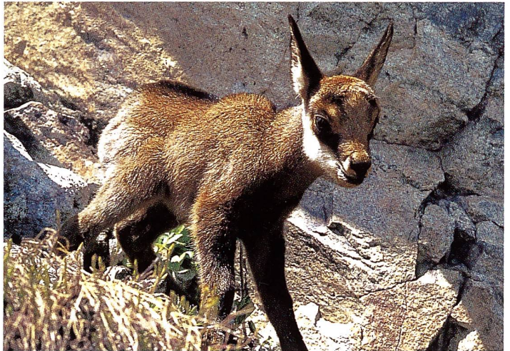
Das Gems-Kitz ( Rupicapra rupicapra ) steht ab Mitte Mai am Berg.