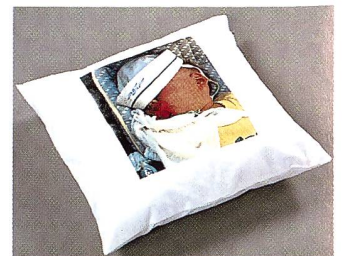
Foto-Kissen, praktisch fürs Sofa, Kinderzimmer oder fürs Auto

Die ansteckende Idee für Freunde, Verein, Anlässe...! Rechteckiger Metallpin in Chrom- oder Goldausführung, 16x25 mm gross, Nadel mit Metallarretierung. Ab sämtlichen Vorlagen wie Fotos, Druckerzeugnissen, Prospekten, Logos sowie von Negativen und Dias. Minimalmenge nur 1 Dutzend!