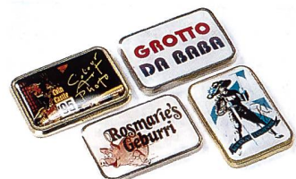
Photo-Pins. Grösse 16x25 mm

Die Fotos werden mit einer Glanzschutzfolie überzogen