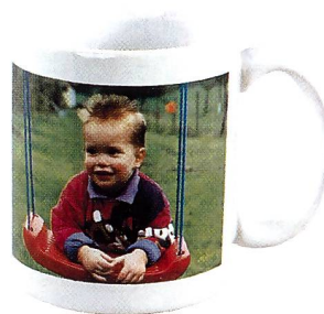
Warum nicht eine Foto-Tasse als originelle Geschenkidee?

Der Familienspass: Vom Kleinpuzzle 13x18 (ca. 40 Teile), z.B. für die Partyeinladung, bis zum ausgewachsenen Puzzle 35x50 (ca. 400 Teile) für den verregneten Sonntag.