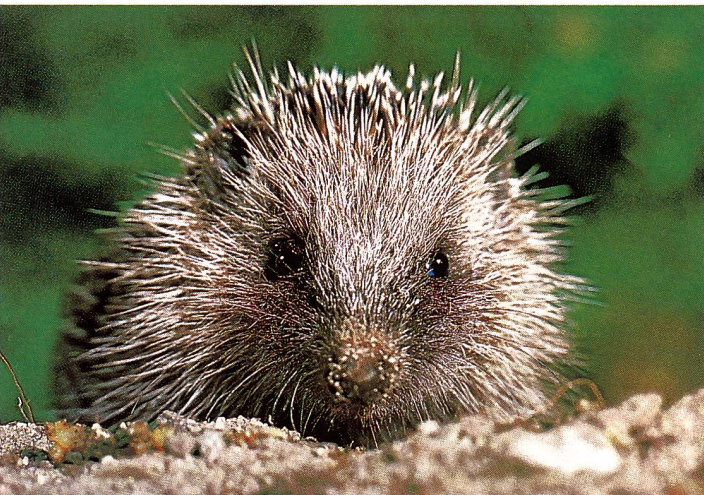
Igel ( Erinaceus europaeus ) sind von Mai bis September jung.