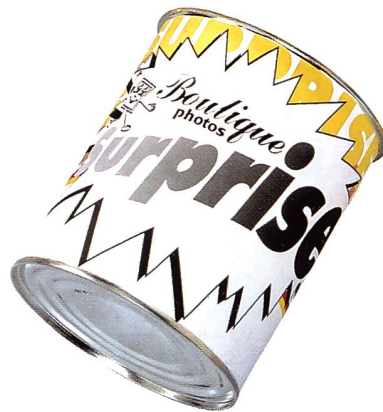
In der Bilder-Boutique-Geschenkdose können Sie auf originelle Art Ihre Geschenke verpacken...

Die Blechdose ist 12 cm hoch, hat einen Durchmesser von 10 cm und kann nur mit einem Büchsenöffner geöffnet werden. Ein Aufkleber, der um die Dose gewickelt wird, kann vom Kunden individuell beschriftet werden. Geeignet zum Verpacken von Boutique-Artikeln wie T-