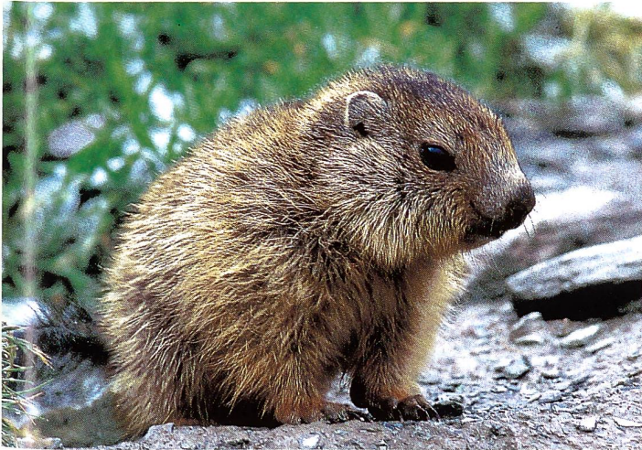
Junges Murmeltier ( Marmota marmota ), ab Mai/Juni auf der Alp.