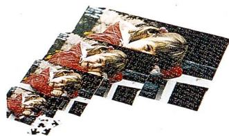
Foto-Puzzle von eigenen Fotos, auf Karton aufgezogen und als Puzzle gestanzt.

Die exklusiven Monats-Fotokalender mit Passepartout sind in drei verschiedenen Größen erhältlich: 13x18, 18x24, 24x35 cm. Aus den Farbvarianten «Bianco», «Marrone» und «Grigio» lässt sich der zum Foto optimale Kalender auswählen. Der Monatskalender lässt sich austauschen. Bei den Jahres-Fotokalendern wird das Foto im Format 35x50 hoch- oder querformatig aufgezogen.