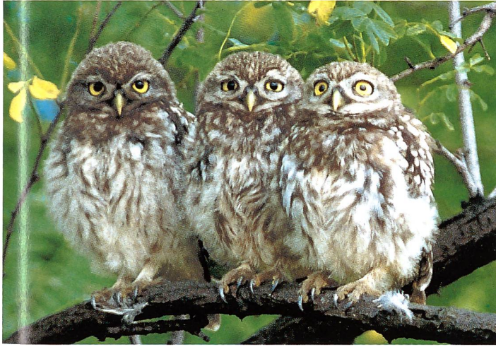
Steinkauz-Ästlinge ( Athene noctua ), ab Mai/Juni aus dem Horst.