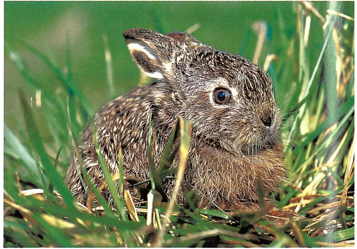
Feldhasen-Nachwuchs ( Lepus europaeus ) gibt's bis zu 4 x im Jahr.