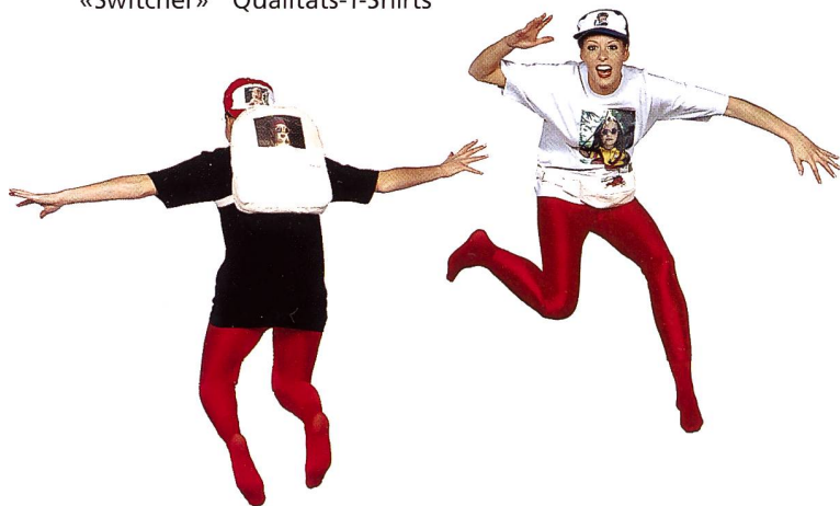
Baumwoll-Rucksack und Photo-T-Shirt mit Mehrfarbendruck.

und Sweat-Shirts, in verschiedenen Grössen und Modellen!