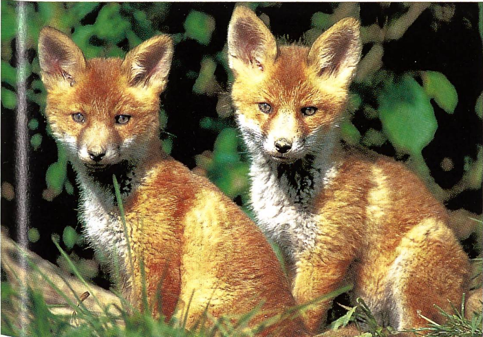
Fuchs-Welpen ( Vulpes vulpes ) lernen im März/April schnüren.