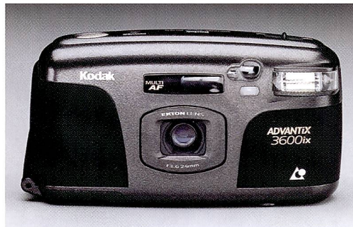
Kodak Advantix 3600ix Camera