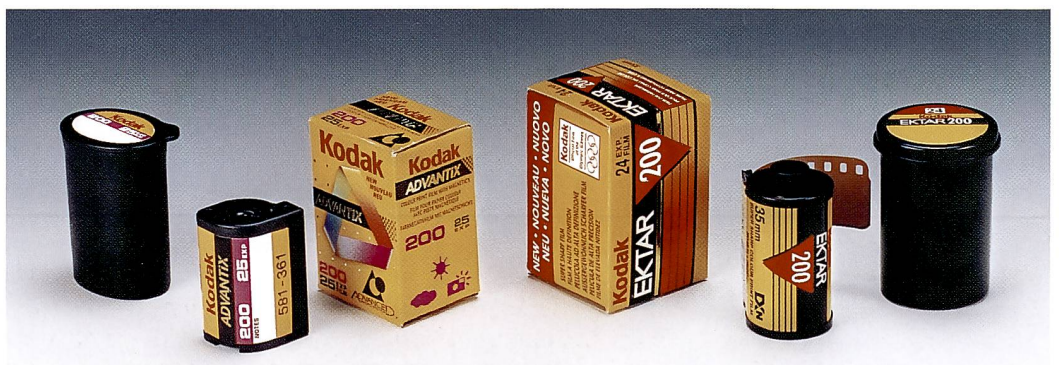
Zwei Filmgenerationen begegnen sich: links die Verpackung einer APS-Kassette, rechts die 35 mm-Patrone

Auf dem Schweizer Markt bietet Kodak vorerst vier Kameramodelle von insgesamt neun Kodak APS-Kameras an, deren Preise bei Redaktionsschluss noch nicht feststanden. Alle Kameras sind mit einem Formatwahlschalter ausgestattet, mit dem zwischen den drei Bildformaten Classic-Bild (C), HDTV-Bild (H) und Panorama-Bild (P) gewählt werden kann. Die Advantix Kameras sind mit der Filmeinlegeautomatik ausgestattet, die den Film nach dem Einlegen der Kassette in die Kamera automatisch einfädelt und nach dem