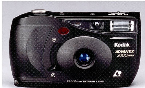
Kodak Advantix 2000 Auto Camera

enormes Entwicklungspotential eröffnet. Die Fotografie wird damit wieder attraktiver und hält Technologiereserven für die Zukunft bereit, um auch längerfristig die Kauflust bei den Konsumenten zu gewinnen. Deshalb ist APS eine Chance für die gesamte Fotobranche, die wir unbedingt nützen müssen.