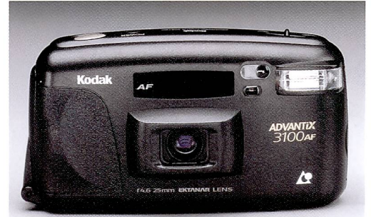
Kodak Advantix 3100AF Camera