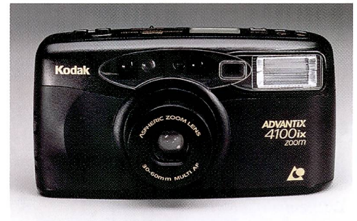
Kodak Advantix 4100ix Zoom Camera

Belichten der letzten Aufnahme wieder zurückspult. Ein Sicherheitsriegel am Filmfach verhindert, dass der Kameradeckel geöffnet werden kann, bevor der Film vollständig zurückgespult ist. Zur Grundausstattung aller Kodak Advantix Kameras gehören ein Selbstauslöser und automatischer Filmtransport.