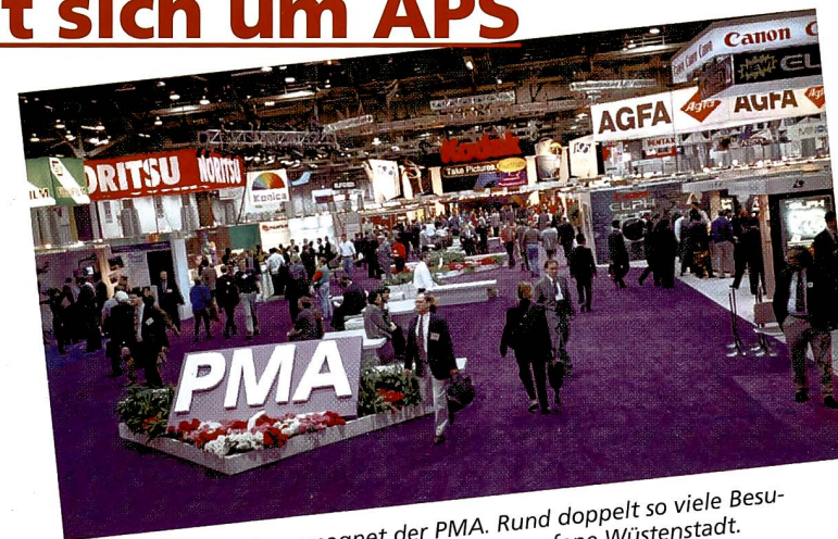
APS war das Publikumsmagnet der PMA. Rund doppelt so viele Besucher wie letztes Jahr in die spielverruffene Wüstenstadt.

Rund 22000 Besucher waren bereits vorregistriert, 25000 könnten es bis zum Schluss werden, die wegen der Fotoneuheiten in die Geldspielmetropole in die Wüste des amerikanischen Bundesstaates Nevada kamen. Das Hauptinteresse galt ohne Zweifel dem neuen Fotosystem APS, das nun allmählich in einem breiteren Markenspektrum beurteilt werden konnte.