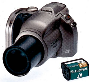
Fuji präsentiert eine APS-«All-in-one»-Kamera.

Neben den «System Developing Companies» gab Agfa klar zu verstehen, dass sie bei APS-System von Anfang an dabei sein werden. Die Agfa «Easy» ist bislang die einzige Einfilmmarkera, bei der das Format auf HDTV und Panora-