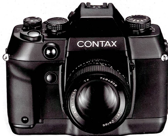
Neue Autofokus-Technologie von Contax: Die neue Contax AX verändert bei der Scharfeinstellung die Lage der Filmebene.