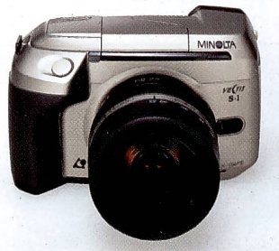
Die Minolta Vectis S-1 APS-Spiegelreflexkamera.

kantprisma sondern über Spiegel seitlich umgelenkt wird. Normalobjektiv ist ein 28–56 mm, fünf weitere Objektive sind dazu geplant. Das APS-Zoomkompaktmodell Vectis 40 besitzt ein Vierfachzoom 30–120 mm. Die ultrakompakte Vectis 25 siedelt sich mit einem 30–75