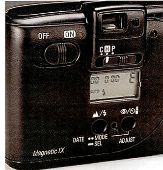
Die Funktionsschalter und Tasten für die Dateneinbelichtung befinden sich auf der Rückseite.

Damit nicht genug. Neben den Eigenschaften des Advanced Photo Systems bzw. des IX-240-Filmformats (IX steht für Information Exchange) warten die Nuvis-Kameras mit weiteren interessanten Leistungsmerkmalen auf. Da ist zum Beispiel der eingebaute und selbst zuschaltende Elektronenblitz, der die Gefahr von roten Augen vermindert und dank Langzeit-Synchronisation bei Nachtaufnahmen das vorhandene Licht harmonisch mit einbezieht. Mit den drei Nuvis-Modellen (und insgesamt sechs Varianten)