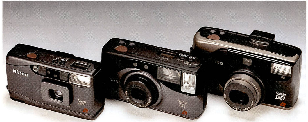
Die drei Nikon Nuvis-Modelle präsentieren sich in einem modernen, ergonomischen und gefälligen Design.

Mit der weltweiten Einführung des Advanced Photo Systems (APS) wird das Jahr 1996 zum Jahr der tiefgreifenden Veränderungen in der Fotografie werden. APS bringt nicht nur Bewegung in die Fotoindustrie; es ist auch damit zu rechnen, dass es durch die konsequente Verschmelzung von bestmöglicher Bildqualität und grösstmöglichem Fotovergnügen Markt und Gewohnheiten revolutioniert. Dies ist denn auch der Grund, weshalb Nikon ihre neue Produktlinie Nuvis nennt: Nuvis – ein Zusammengug von «New» und «Vision» – widerspiegelt Nikons Vision von einer völlig unbeschwerten und bildmässig dennoch perfekten Fotografie und ist eine Referenz an die wesentlichen Vorzüge des Advanced Photo Systems: Nuvis steht auch für kompakteres Design, für grössere Printvielfalt und noch einfachere Bedienung.