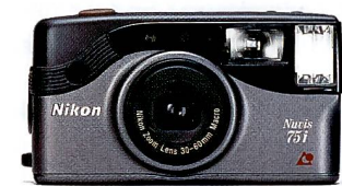
Nikon Nuvis 75i