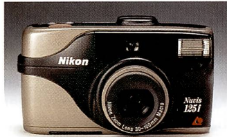
Nikon Nuvis 125i

ten) lässt Nikon einen Wunsch unzähliger Hobbyfotografen Wirklichkeit werden – den Wunsch nach Kameras, die so kompakt sind, dass sie jederzeit dabei sein können,