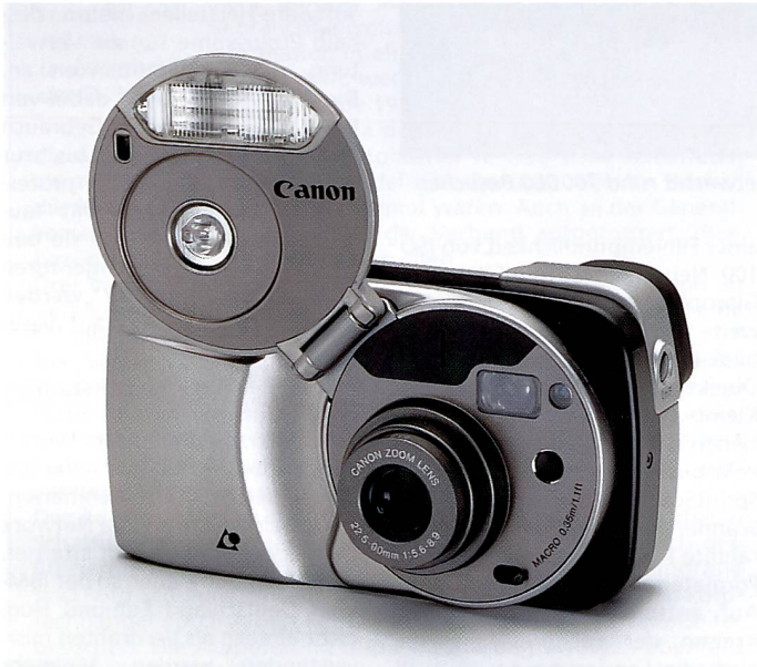
Die auf den Herbst angekündigte Canon Ixus Quattro hat ein Vierfachzoom 22,5-90 mm, was bei KB 35-115mm entspricht.

sehen. Ein ganzer Kamera-Blumenstrauss folgt von Canon also, auch wenn wir uns zunächst «nur» mit der Ixus begnügen müssen. Sie hat allerdings alle Chancen, zu einem Renner zu werden und viel zur schnellen Markteinführung von APS beizutragen.