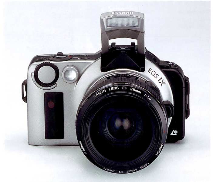
Die Canon EOS-IX kommt ebenfalls im Herbst und ist ein APS-Spiegelreflexmodell mit einem Anschluss für EF-Objektive.

sen, ein Metallgehäuse und ein Vierfach-Zoomobjektiv, 5,6-8,9/22,5-90 mm besitzen. Interessant ist auch der Aufklappblitz im Objektivdeckel, der mit einer weiten Distanz zum Objektiv bezüglich Ver-