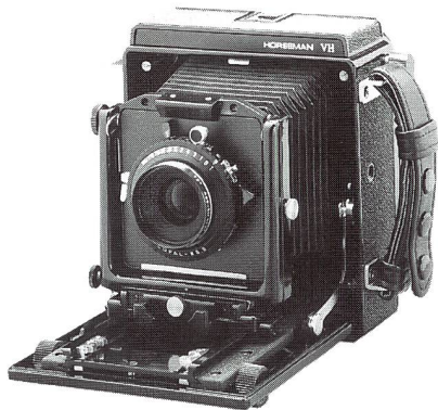
Super Weitwinkel Kamera SW 612

Horseman-Kameras sind echte Arbeitstiere für den realen Alltagsgebrauch.