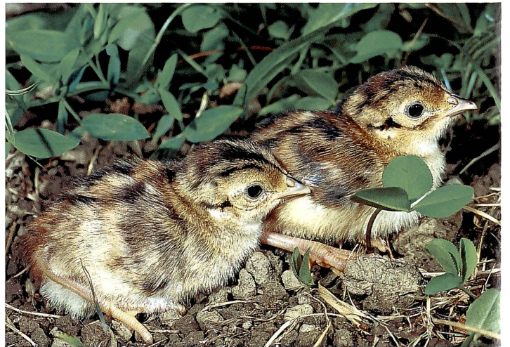
Küken des Fasans ( Phasianus colchicus ), April bis Juni.