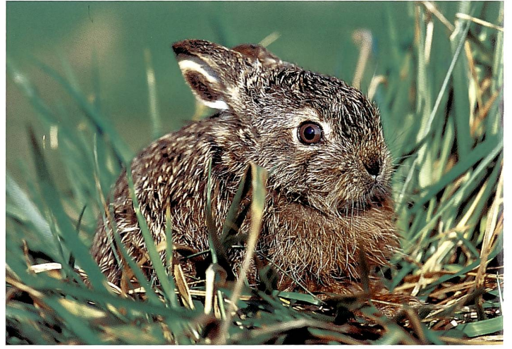
Feldhasen-Nachwuchs ( Lepus europaeus ) gibt's bis zu 4 x im Jahr.