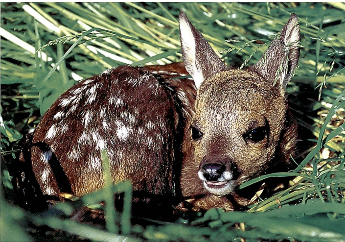
Reh-Kitz ( Capreolus capreolus ) macht erste Kapriolen im Mai/Juni.