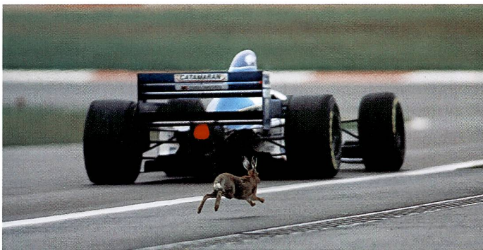
Der Gewinner des Wettbewerbs «Sportfoto des Jahres 1995» Sörli Binder aus Walldorf (D) fotografierte diesen sensationellen Schnappschuss mit einer Canon EOS 1 und einem 400 mm-Objektiv.

Die neue Pentax MZ-5 ist einerseits mit zwei praktischen Einstellrädern auf einfache Handhabung konzipiert und bietet andererseits eine reichhaltige technische Ausstattung (eingebauter Blitz, 6-Feld- und Spotmessung, vorausberechnendes AF-System, Programm-, Zeit- und Blendenautomatik) für hohe Ansprüche. Pentax (Schweiz) AG, 8305 Dietlikon, T: 01/833 38 60, F: 01/833 56 54