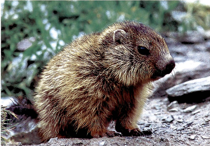
Junges Murmeltier ( Marmota marmota ), ab Mai/Juni auf der Alp.