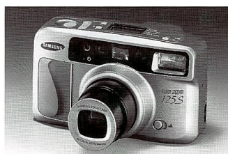
Die Samsung Slim Zoom 125 kommt in zwei Monaten

Zoomautomatik, Intervallschaltung, Funktion für Serienaufnahmen, Mehrfachbelichtung, Spotmessung, Belichtungskorrektur (+3 EV) Panoramaformat, Langzeitmodus bis 60 Sek., Automatikblitz mit Leitzahl 18 (ISO 100) und Aufhellfunktion bei Gegenlichtsituationen und Vorblitzwahl, Unendlicheinstellung und optionaler Fernbedienung.