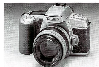
Die Samsung SR 4000 wird in der Schweiz erhältlich sein

Mit der SAS 628 steigt Samsung ab September in das Fotosystem APS ein. Die Kamera besitzt ein 28–60 mm-Zoom, drei Bildformate, vier Programme (Normal, Porträt, Schnappschuss und Landschaft), drei Blitzfunktionen, Nahgrenze von 60 cm, IX- und PQI-Datenaustausch, Rückseitenaufdruck von Zeit Datum und Titeln in 11 verschiedenen Sprachen sowie die üblichen APS-Eigenschaften. Mit den Aussenmassen 110 x 62 x