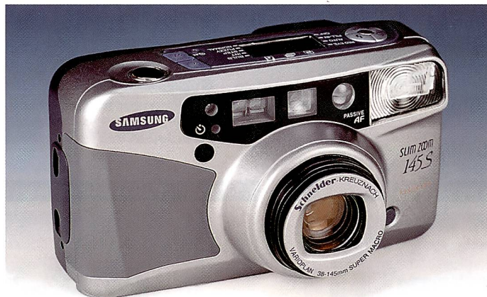
Neues Topprodukt der Samsung-Linie: Die Slim Zoom 145 ist mit einem Objektiv 38–145 mm von Schneider-Kreuznach ausgestattet

Das neue Leaderprodukt des Samsung-Sortimentes ist die Samsung Slim Zoom 145. Sie ist mit einem von Schneider-Kreuznach (der Zusammenschluss mit Rollei trägt erste Früchte) entwickelten Zoomobjektiv 38–145 mm (Lichtstärke 1:3,9–10,9) versehen. Zur weiteren technischen Ausstattung gehören das Fuzzy Logic-Programm (das gewisse Kameraeinstellungen motivbezogen selbsttätig vornimmt), passives Mehrzonen-Autofokus mit 120 Stufen und kürzester Aufnahmeentfernung von 60 cm, LCD-Zoomsucher mit Parallaxausgleich, Porträt- und Mehrstufen-