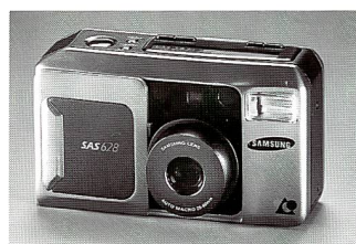
Die Samsung APS-Kamera SAS 628 Zoom ist für Juli vorgesehen

Zoomautomatik, Intervallschaltung, Funktion für Serienaufnahmen, Mehrfachbelichtung, Spotmessung, Belichtungskorrektur (+3 EV) Panoramaformat, Langzeitmodus bis 60 Sek., Automatikblitz mit Leitzahl 18 (ISO 100) und Aufhellfunktion bei Gegenlichtsituationen und Vorblitzwahl, Unendlicheinstellung und optionaler Fernbedienung.