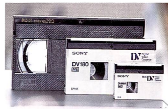
Grössenvergleich: VHS, Standard-DV, Mini-DV

lenter Bildqualität einen angenehm grossen Farbsucher und verblüfft mit einem sehr geringen Bildrauschen im Low-Light-Bereich. Den Vogel abgeschossen hat jedoch JVC mit seinem GR-DV 1. Dieser digitale Camcorder ist der bisher kleinste und leichteste Camcorder überhaupt. 18,4 cm hoch, 8,8 cm breit und nur 500 Gramm schwer, passt er in jede Jackentasche und bietet trotzdem eine bessere Bildqualität als der beste analoge Camcorder.