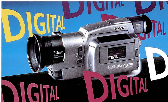
Die neuen digitalen Camcorder stehen den bisherigen analogen Geräten bezüglich Grösse und Ergonomie nicht nach.

DV steht für Digital Video und wird der zukünftige Video-Standard im Consumerbereich werden. Über 50 Unternehmen aus der Video- und Computerbranche haben sich darauf geeinigt. DV-Bänder gibt es in zwei Ausführungen: als Mini-DV-Kassette in der Grösse einer Streichholzschachtel für Camcorder mit maximal 60 Minuten Laufzeit und als Standard-DV-Kassette für Heimrecorder mit einer Spieldauer von bis zu 270 Minuten. Bereits erhältlich sind der Drei-Chip-Camcorder DCR-VX1000 von Sony und sein kleiner, «einäugiger» Bruder