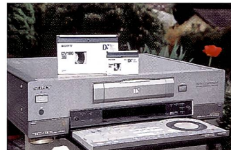
DV-Videorecorder von Sony