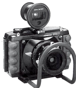
Super Weitwinkel Kamera SW 612