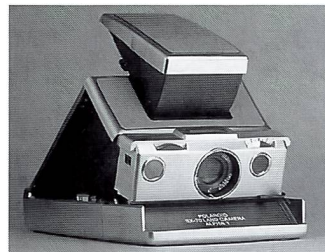
Eine Legende lebt wieder auf: Aus dem Holzmodell der faltbaren Sofortbildkamera (1967) entstand 1972 die berühmte SX-70. Das Nachfolgemodell SLR 680 wurde bis 1987 produziert und feiert nun auf Grund anhaltender Nachfrage mit der SLR 690 ein Comeback.

Die neue Polaroid SLR 690 bietet alle Besonderheiten der ursprünglichen SLR 680 und greift das Design der legendären Polaroid SX-70 wieder auf. Im Zuge der technischen Weiterentwicklung wurden die ursprünglichen IC-Chips für die Belichtungssteuerung allerdings von einem digitalen Mikroprozessor abgelöst.