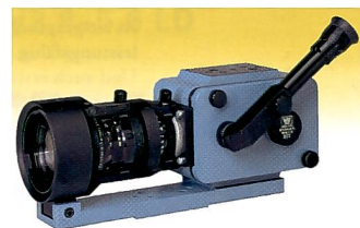
Die Schweizer Stalex Kamera zeichnet 3000 Bilder/Sek. auf.

Versuche aufgezeichnet werden, und bei diesen hohen Bildfrequenzen lassen sich Details festhalten, die von blossen Auge gar nicht mitverfolgt werden können. Die Stalex Präzisionskamera ist sehr klein gebaut, damit sie auch im Versuchsfahrzeug eingesetzt werden kann. Kamera und Objektiv sind so konstruiert, dass sie den gewaltigen Kräften, wie sie bei der Beschleunigung und beim Crash des Fahrzeuges vorherrschen, widerstehen können und auch unter diesen extremen Bedingungen noch voll funktionstüchtig sind. Als ideale Ergänzung zu den Hochgeschwindigkeits-