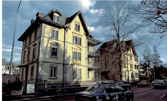
Die beiden gelben Nikon-Häuser an der Seestrasse sind unübersehbar.

Wir unterstützen das zef nach wie vor, und wir sind gerne bereit, uns im zef an markenübergreifenden Kursen zu beteiligen. Zusammen mit der Berufsausbildung ist das die Stärke des zef.