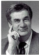
Urs Tillmanns Fotograf, Fachpublizist und Herausgeber von FOTOintern

Also gewisse Kamerabezeichnungen schreibe ich einfach nicht, weil sie unsinnig und widersprüchlich sind. «Sucherkamera» beispielsweise ist so ein Unwort. Oder kennen Sie vielleicht irgendeine Kamera, die keinen Sucher hat? Es gibt Kompaktkameras (auch fragwürdig – wie kompakt ist kompakt denn wirklich?) oder noch kleinere Taschenkameras meinetwegen – aber «Sucherkameras» gibt es in meinem Lektorat einfach keine! Dann die «Einwegkameras»! Seit Jahren hämmert uns die Industrie ein, es seien Mehrwegkameras, weil sie im Werk nicht entsorgt, sondern unter Mehrfachverwendung gewisser Teile wieder in den Verkauf zurückgelangen würden. Und wer spricht trotzdem unentwegt von Einwegkameras? Dieselbe Industrie! Lösung? Einfilmmkameras. Damit ist alles klar. Auch der ähnlich klingende Ausdruck «Einmal-kamera» ist unbrauchbar, weil man nicht einmal, sondern 27 mal auslösen kann. Kleinigkeiten? Sicher – aber wer verlangt denn immer, dass ich's genau nehmen soll ...?