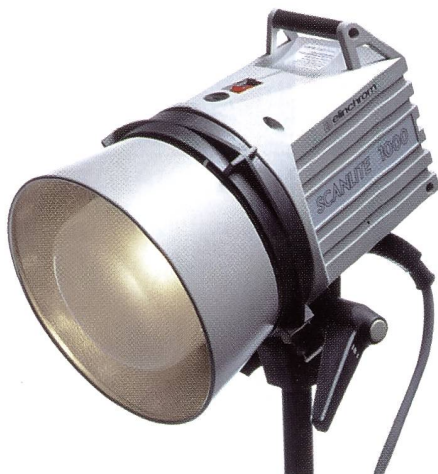
Das Scanlite 1000 von Elinchrom ist eine preisgünstige Scanleuchte mit Kunstlichtcharakteristik.

Alle sprechen von Digitalkameras und lassen dabei ausser acht, dass das Aufnahme­licht eine sehr wichtige Bedingung ist, um zu guten Scans und Bilddaten zu kommen. Elinchrom führt zwei Spezialleuchten für die digitale Fotografie und professionelles Video in ihrem Programm.