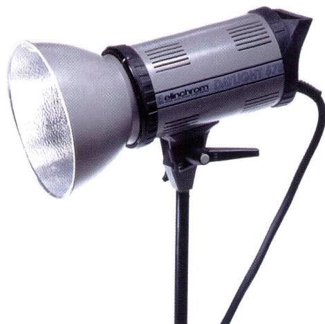
HMI-Licht ist reines Tageslicht und deshalb auch für die Aufhellung bei Aussenaufnahmen geeignet.

Bei Dauerlichtquellen, die für Digital- und Videoaufnahmen geeignet sind, unterscheidet man grundsätzlich zwischen Halogenlicht und HMI-Licht. Beide gewährleisten – im Gegensatz zu gewöhnlichen Fotolampen – während der gesamten Leuchtdauer der Röhre eine konstante Lichtqualität. Hauptunterschied ist die Verteiltemperatur, die bei Halogen rund 3400 K und bei HMI tageslichtähnliche 5600 K beträgt.