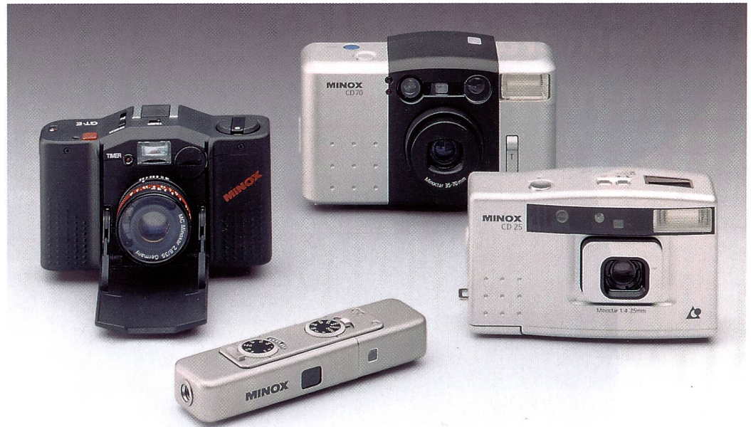
Die neue Minox-Linie: Neben den bisherigen Spezialitäten, der Klapp- und der Miniaturkamera, präsentiert Minox nun auch eine Zoomkompakt- und eine APS-Kamera. Sie lassen das neue, einheitliche Erscheinungsbild künftiger Minox-Produkte erkennen.

Die beiden wichtigsten Kameramodelle im Kleinbildbereich sind die Minox CD 70 mit einem Zweifachzoom 35-70 mm und die APS-Taschenkamera CD 25.