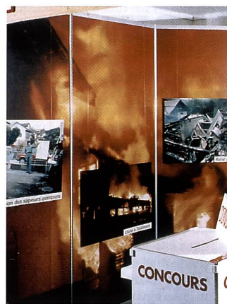
Der digitalen Fotografie deutlich überlegen: wandgrosse Präsentationsbilder direkt ab Kleinbildnegativen.

Die Bedürfnisse der Kunden kennen! Ein wichtiger Grund-