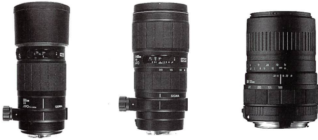
APO Tele Macro 4/300 HSM APO 2,8/70-210 (HSM) Zoom 4,5-6,7/100-300 UC

Macro 300 mm ist eine manuelle Scharfeinstellung jederzeit und ohne Schalterumstellung möglich. Das AF-Objektiv ist mit Canon-, Minolta-, Nikon- (nur MF), Pentax- und Sigma-Anschluss erhältlich. Das Objektiv ist mit einem elektrischen Kontakt ausgestattet, der in Verbindung mit den neuen Sigma AF-Konvertern (siehe unten) den vollen Bedienungskomfort gewährleistet.