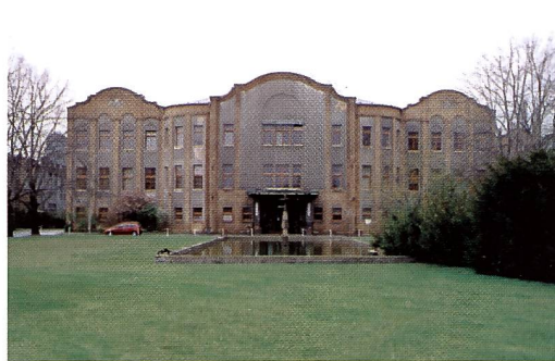
Das Verwaltungsgebäude der 30er Jahre

und Filmmuseum Wolfen» späteren Generationen dokumentieren, wie und wo einst die ersten Agfacolor-Filme hergestellt wurden. Das Museum ist weltweit einmalig in