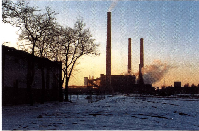
Sonnenuntergang in Wolfen: Bald werden auch die drei Schornsteine fallen. Vom ehemaligen Agfa-Filmwerk bleiben ein leeres, investitionsberechtigtes Industriegelände und ein Museum.

Wenn man das Riesengelände der früheren Agfa-Filmwerke in Wolfen durchfährt, so wird einem die Tragik bewusst, die hinter dem Entscheid vom 20. Mai 1994 der «Treuhand» steht, die Produktion einzustellen und die Firma zu liquidieren. Von den einst 590 Gebäuden stehen nur noch jene, die entweder unter Denkmalschutz stehen, oder solche, die durch Neugründungen von Einzelbetrieben weiter genutzt werden konnten. Alles andere ist Bauschutt geworden. Von den vielen Einzelschicksalen der rund 15000 Angestellten in der einstigen Chemiemetropole Bitterfeld ganz zu schweigen.