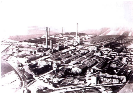
Das Agfa-Werk zur Zeit der ersten Farbfilme