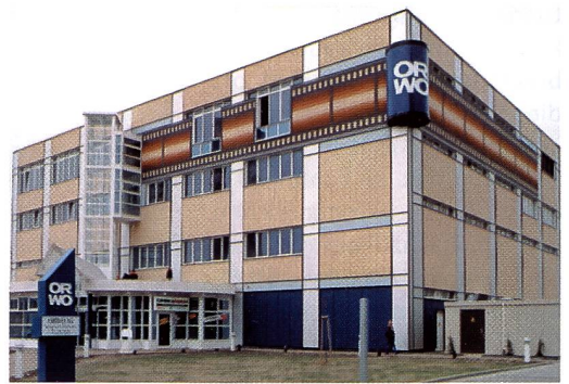
Die neue Orwo baut ihre Marke wieder auf

Geschäftsführer der neuen Orwo eingesetzt. Nun wird in renovierten Räumlichkeiten OEM-Filmmaterial konfektioniert und über die bisherigen, bewährten Vertriebskanäle unter der bisherigen Marke Orwo abgesetzt. Zudem wird