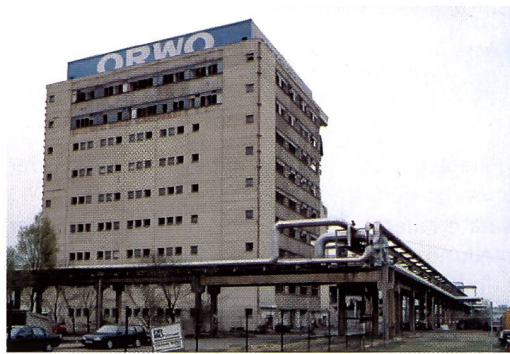
Die alte Orwo weicht einem neuen Industriezentrum

seiner Art, denn in keinem anderen Fotomuseum oder Filmwerk der Welt ist eine vollständige Produktionsanlage für Fotomaterial der Öffentlichkeit zugänglich. Noch etwas Positives gibt es aus Wolfen zu berichten: Der