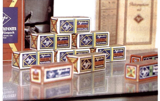
Agfacolor-Filmverpackungen um 1950

gegenwärtig ein Grosslabor eingerichtet, das auf die Produktion von 50 bis 60 Millionen Farbbildern pro Jahr ausgelegt ist. Weiter ist die Produktion von Rohfilm