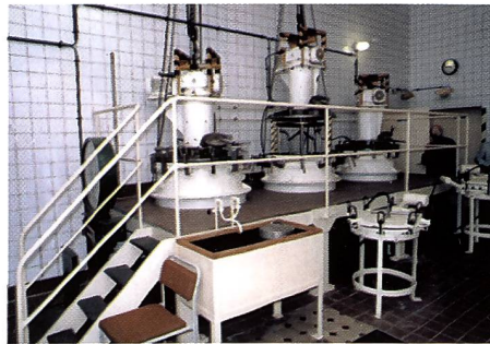
Mischanlage für den Ansatz der Emulsionen