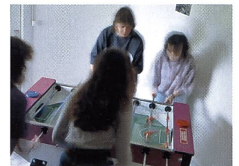
Gehört dazu: Spass und Spiel