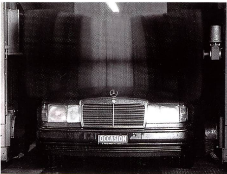
Reportagebild von Victoria Thalmann

fung einen Schnitt von 4,3 (Vorjahr 4,3), beim Verkauf 4,9 (4,9) und bei den Berufskenntnissen 4,6 (4,9). Auch dieses Jahr bestätigte sich wieder, dass Fotofachangestellte auch sehr gute Verkäufer sind. Mit wenigen Ausnahmen wurde durchwegs Note 5 oder höher erreicht.