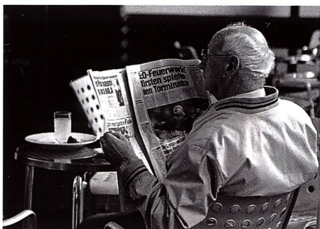
Reportagebild von Andreia Carvalho