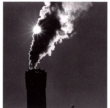
Reportage von Christian Reding