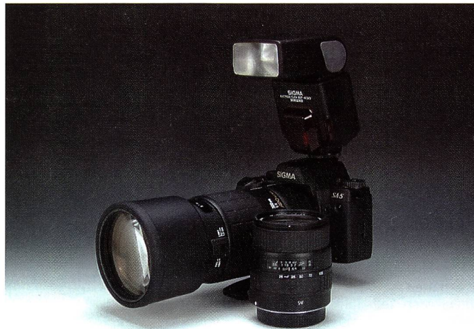
Die Testausrüstung: Sigma-Spiegelreflexkamera SA-5, Objektiv 28-105 und 300mm sowie Systemblitzgerät EF-430 Super

Die Ausstattung der SA-5 bietet so ziemlich alles, was sich ein Spiegelreflex-Fan wünschen kann. Da gibt es