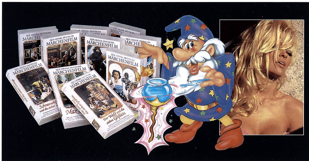
ROWI bietet neu Videofilme aus der Welt der Märchen, des Trickfilms und der Erotik an. Mit einem speziellen Verkaufsdisplay sind die Videofilme als preisgünstige und attraktive Mitnahmeprodukte ein gutes Zusatzgeschäft.

Die Besucher der Orbit haben es uns bestätigt: Leute, die sich für Fotografie interessieren, haben auch andere Inte-