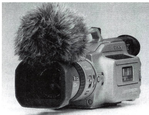
«Kamera mit Perücke»? Der Rycote Windschutz reduziert Windgeräusche auf ein natürliches Mass.

ressen, die mit dem Bild zusammenhängen.