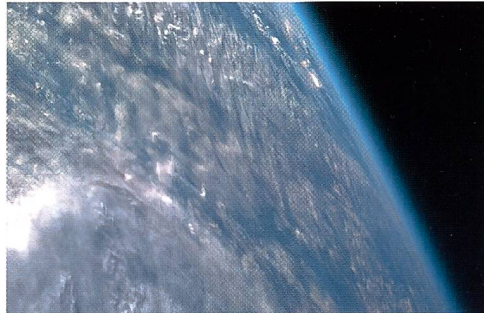
Aufnahmen, die im Rahmen des Kidsat Pilotprojektes anlässlich einer Space Shuttle Mission im September dieses Jahres entstanden

Zu diesem Zweck ist das Space Shuttle Atlantis STS-86 mit einer hochauflösenden Kodak DCS 460 Digitalkamera ausgerüstet. Über das Internet wählen die KidSat-Teilnehmer die Ziele für die Digitalkamera an Bord des Space Shuttles aus. Die aufgenommenen Bil-