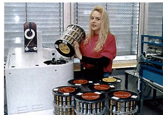
Im Desplicer gelangen die APS-Filme wieder in ihre Kassette

korrekturen eingibt, sämtliche Informationen auf einen Blick vor sich.