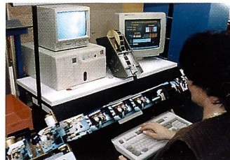
Der Korrekturtisch. Eine Videokamera liest die Bildrückseite