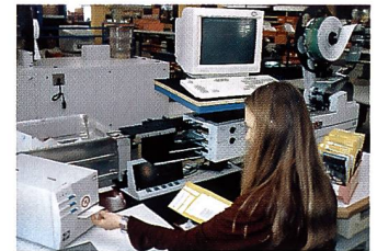
Die Schneideanlage mit dem Preisauszeichnungsgerät

Bei Pro Ciné werden auch APS-Aufträge einer minziösen Kontrolle in Dichte und Farbe unterzogen. Der immer noch relativ grosse Anteil an Korrekturen verursacht einen immensen Aufwand. Die Idee, die einzelnen Geräte mitein-