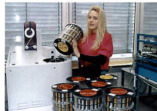
Im Desplicer gelangen die APS-Filme wieder in ihre Kassette

korrekturen eingibt, sämtliche Informationen auf einen Blick vor sich.