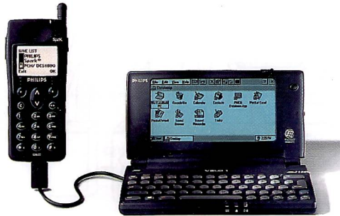
Taschencomputer mit Natel-Anschluss ermöglichen den Internet-Zugang von unterwegs. So ist Internet noch grenzenloser

Der Explorer ist noch «kostenloser» und wurde von Micro-