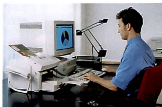
Ob Pultstation oder elegantes Notebook spielt keine Rolle. Mit beidem kann man über ein Modem ins Internet.

Der heute für Einzelanwender übliche Internetzugang erfolgt über eine ganz nor-