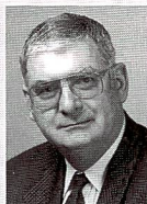
Hans Peyer Präsident des SVPG

Kürzlich hatte ich ein Telefongespräch mit einer Lehrtochter, deren Ausbildungszeit als Fotofach-Angestellte mehr als zur Hälfte vorbei ist. Sie sorgt sich, im Fach Verkauf zu wenig gut ausgebildet zu sein. In ihrem Lehrbetrieb sind praktisch keinerlei Kameras oder Geräte und Zubehöre dazu vorhanden. Am Ladentisch werden die im eigenen Mini-lab gemachten Bilder ausgeliefert, deren Weiterbearbeitung (Vergrößerungen, Aufziehen, Einrahmen usw.) angeboten oder das Material für deren Präsentation wie Rahmen, Alben usw. verkauft. Daneben werden in diesem Betrieb als