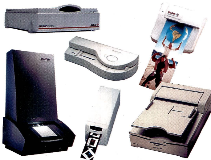
Scanner gibt es in den unterschiedlichsten Bauarten und Preiskategorien. Eine genaue Abklärung der Bedürfnisse vor dem Kauf ist deshalb ratsam.

Für das Erzeugen eines Farbbildes sind pro Bildpunkt Helligkeitsinformationen in den drei Grundfarben Rot, Grün und Blau notwendig. Die meisten modernen Scanner arbeiten mit der Single-