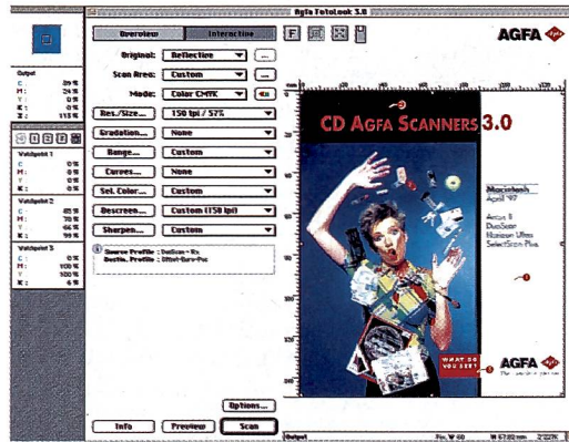
Die Software ist für die Qualität der Scans mitverantwortlich.

nal, auf dem Monitor und auf dem Ausdruck identisch – oder zumindest so ähnlich wie nur möglich.